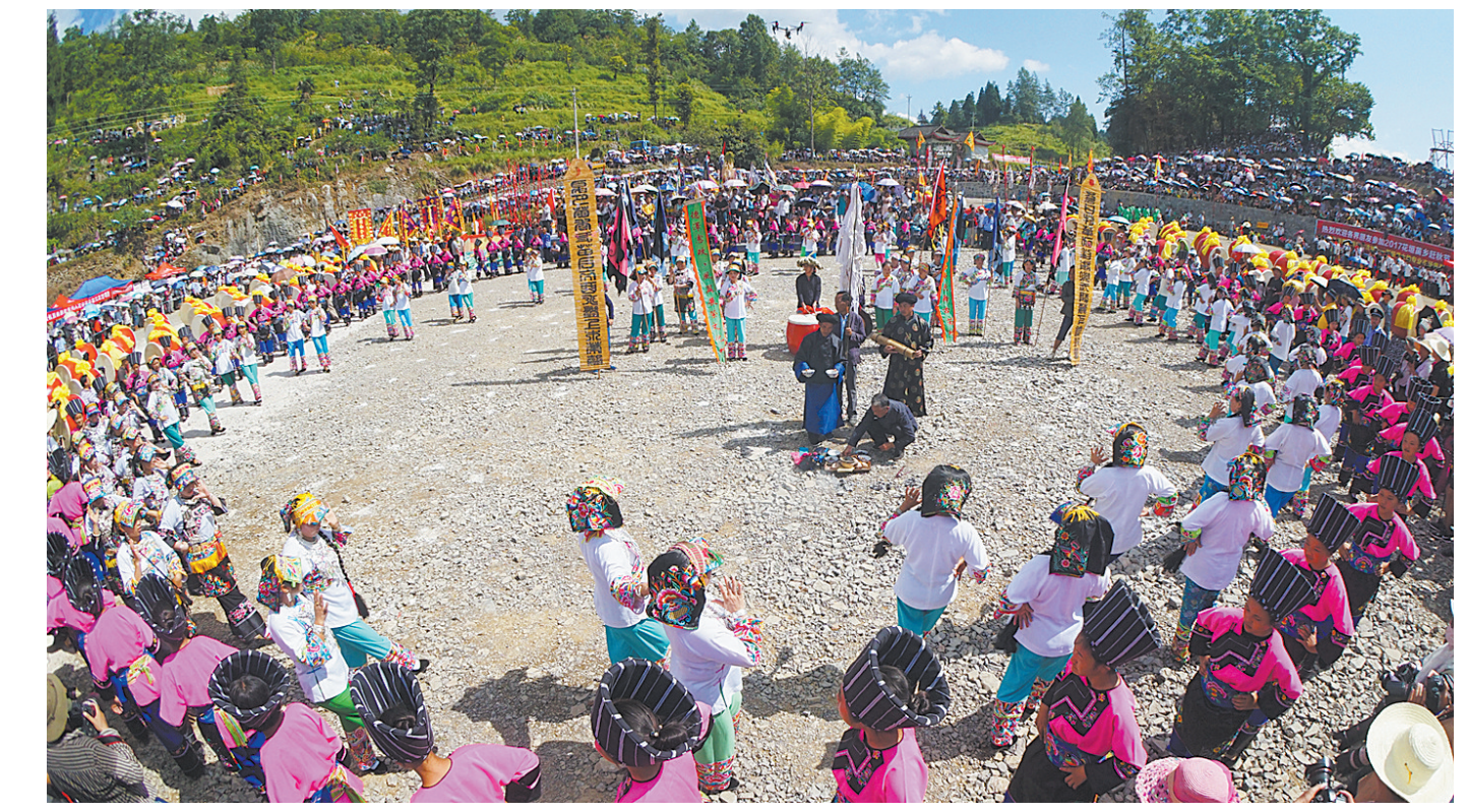
申遗成功后苗族同胞共庆“赶秋节”

新华社青岛8月7日电(李唐 吴登峰)海军7日在黄海、渤海相关海空域组织了实兵实弹对抗演习，最大限度检验体系作战能力、战法训法、武器装备效能，共实射各型导弹数十枚。 这次演习是军队规模结构和力量编成调整后，海军首次组织在黄海、渤海两个方向同时实施的大型实兵实弹演习，是根据年度训练计划做出的例行性安排。 演习参演兵力以各战区海