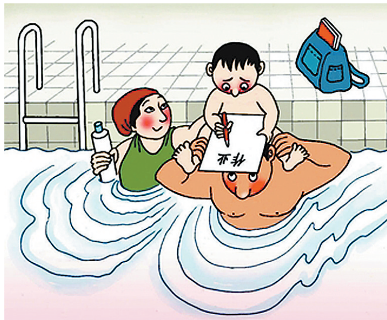
避暑 邸天行 作

可是,亲爱的,爱自己不是照着时尚杂志复制一份购买清单,花掉血汗银子换取朋友圈一年一度的旅行大赛。