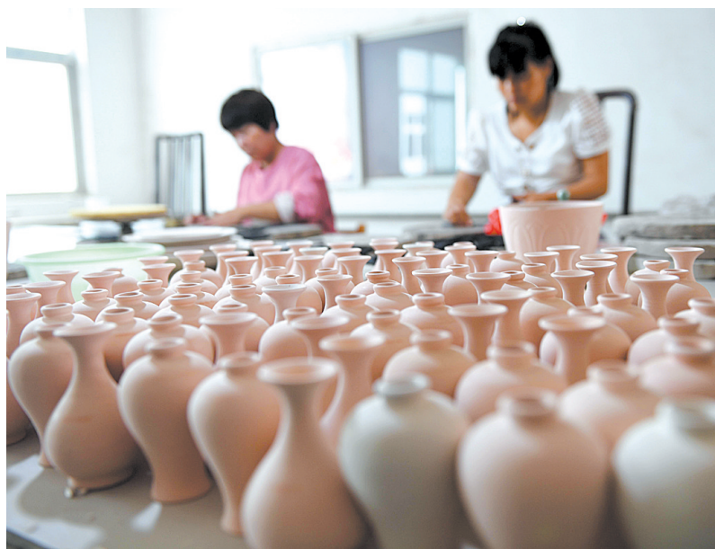
宝丰大力推动汝瓷产业发展

“下一步,我们将继续紧紧围绕市委、市政府的中心工作,坚持‘四服务、一加强’,把科协建成开放型、枢纽型、平台型科技工作者之家,成为提供科技类公共服务产品的社会组织,助力全市转型发展大局。”该负责人说。