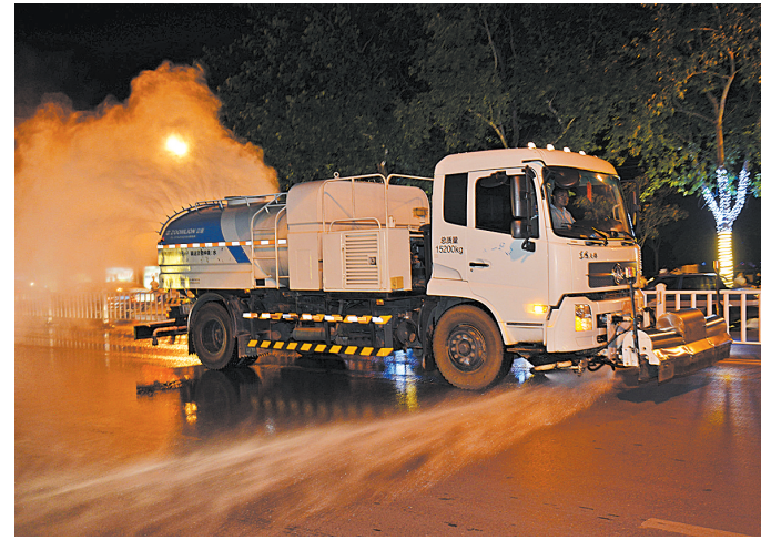
6月27日晚,新华区环卫局环卫工人利用多功能车在市区建设路二段喷雾除尘。

此次行动共检查餐饮单位700余家,出动执法人员2000余人次。目前,餐饮单位油烟净化设施安装率已达100%。