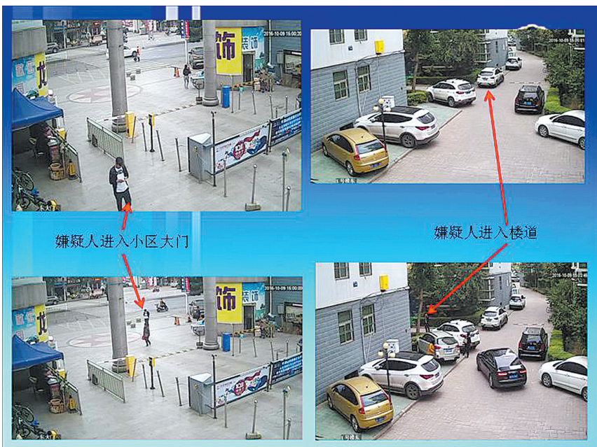
犯罪嫌疑人进入小区监控视频画面