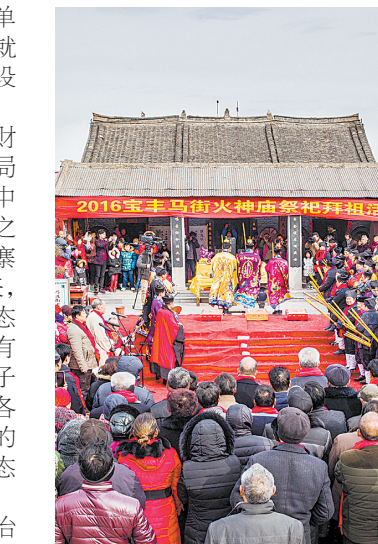
宝丰马街火神庙祭祀现场