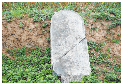
《马街火神庙留养杨树碑记》