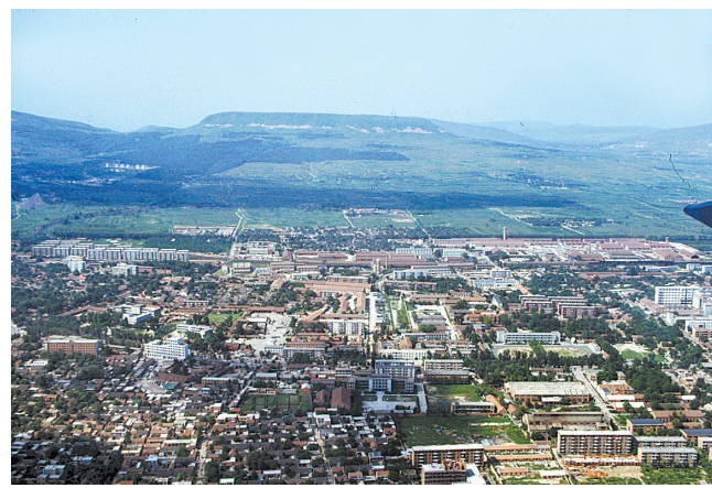
上世纪80年代的新华路周边