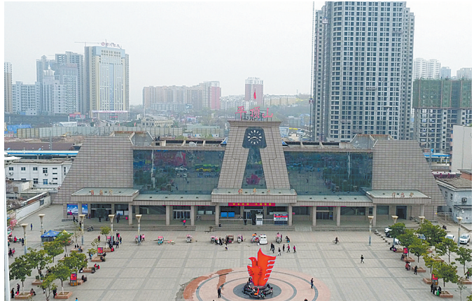
平顶山火车站新貌