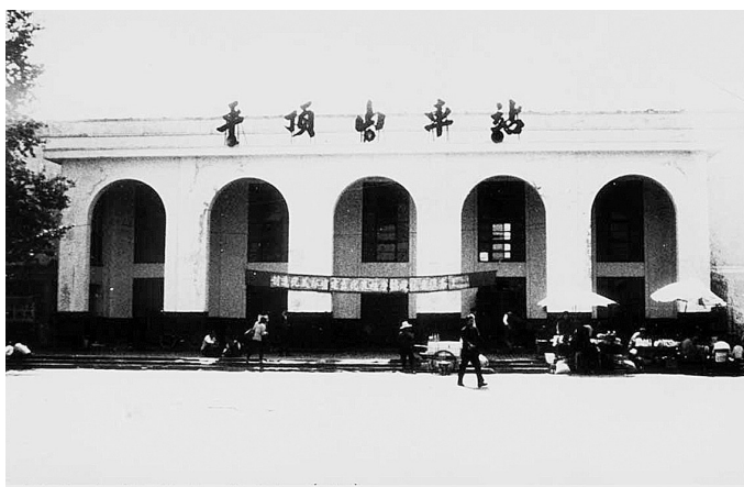
上世纪80年代的平顶山火车站