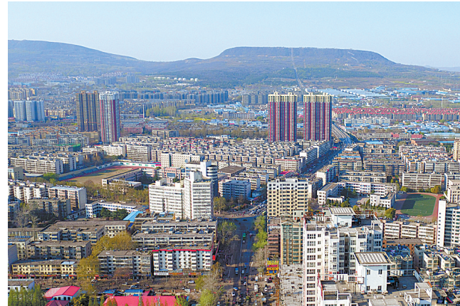
如今的新华路周边高楼林立