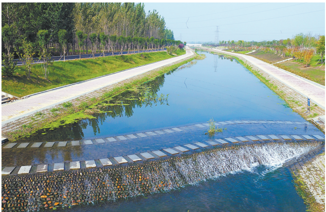
治理后的湛河美景