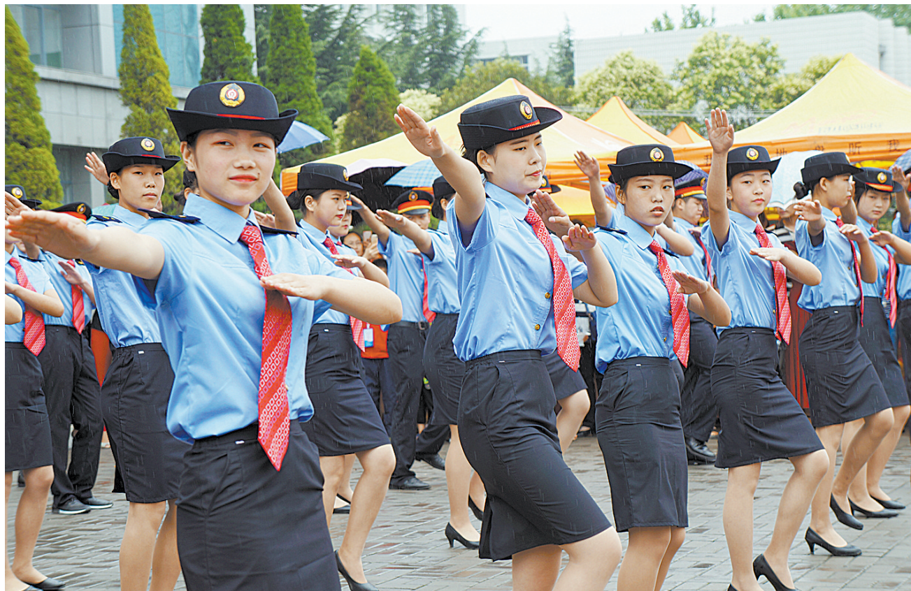
在校园开放日,学生跳起欢快的舞蹈《小苹果》

校长杨全军说,社团活动是丰富初中高中阶段学生业余文化生活、培养学生兴趣爱好的一种重要载体。学校鼓励、支持学生参与社团活动,希望通过举办形式多样、内容充实的社团活动培养学生的创新能力和实践能力,使学生得到多元化的发展,促使其素质全面提升。