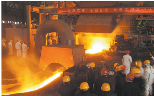
炼铁炉前,工人们有条不紊地操作