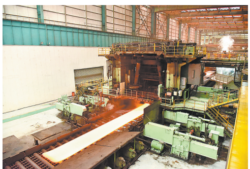
舞钢公司生产车间