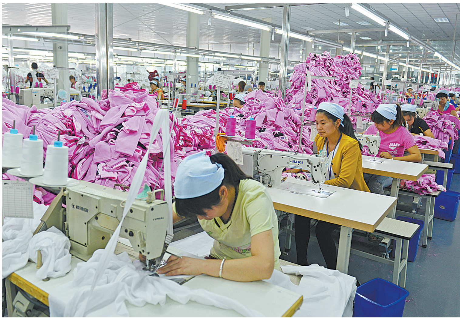
服装企业加紧生产,以供出口

回望过去,舞钢市的工业基础几乎为零,直至1970年建设舞钢公司,才拉开了工业发展的序幕。