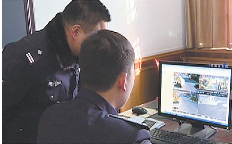
办案民警在察看视频监控资料

案发现场位于该温泉度假村别墅,该别墅为上下两层,现场勘查组经过现场勘查,未获取有效的痕迹物证,在别墅