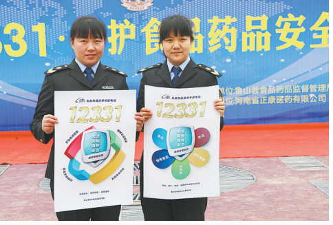
开展“12331”守护食品药品安全主题宣传活动