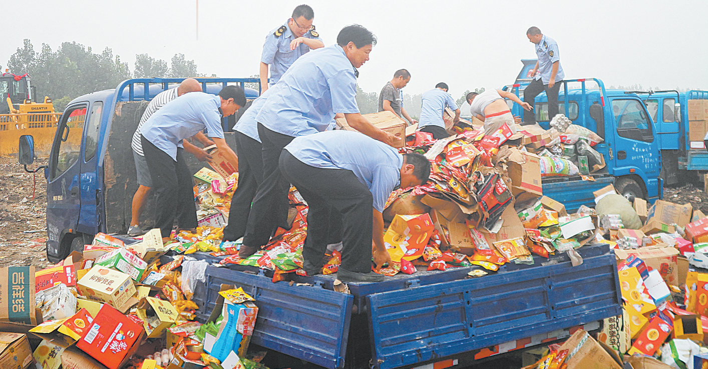
集中销毁不合格食品药品