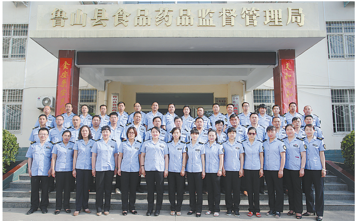
朝气蓬勃的鲁山县食药监队伍