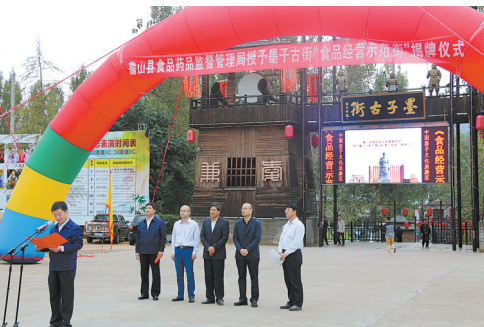
授予墨子古街“食品经营示范街”称号