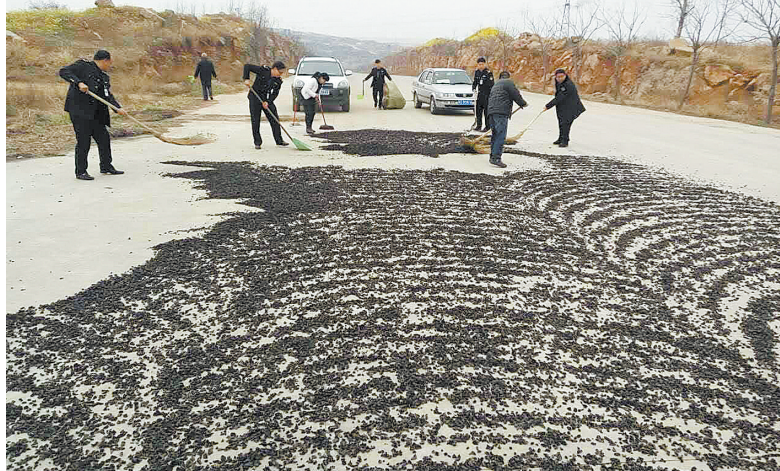
没收掺杂掺假木耳