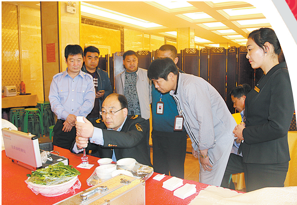
保障鲁山县两会食品安全