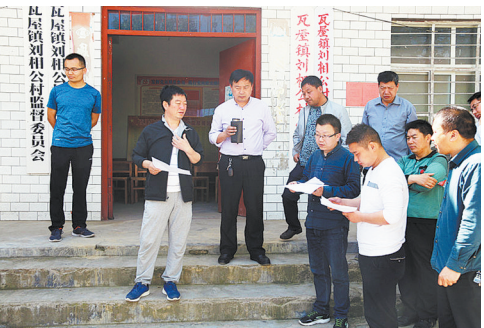
大力开展扶贫工作