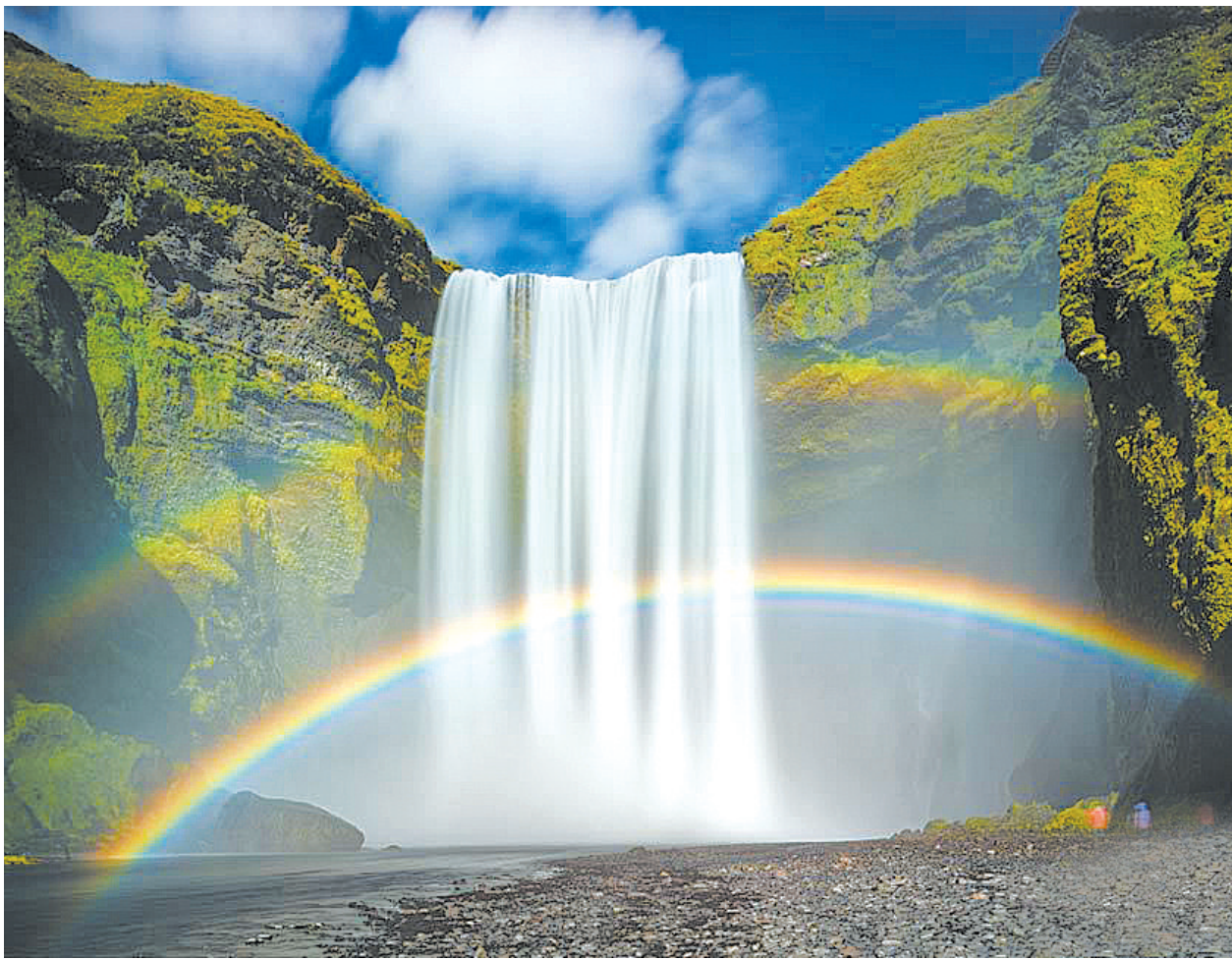
冰岛绝美瀑布景观：彩虹环绕宛如仙境

“不动笔墨不读书”，不要对此不以为然。如果能长期坚持下去，相信你能从中收获良多。生活中有很多人，他们谈话的时候显得很有学问，可当别人要他们写点东西时，你会发现，他们的文字粗劣，观点生硬，甚至语句不通，有时还在引用名言诗句时出现错别字。说到底这与平时对书中的观点与文字把握不准确，记得不牢靠有关，如果能养成“不动笔墨不读书”的好习惯，还会出现这种情况吗？至少会大大减少出现这种情况的概率吧。