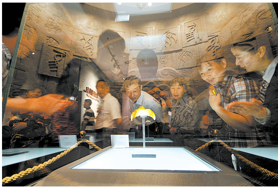
2012年5月15日,市民在平顶山博物馆观看镇馆之宝玉鹰。