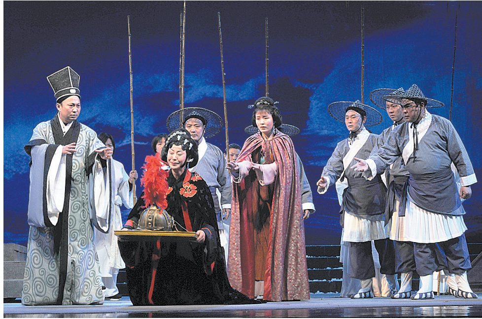
2009年3月25日,市豫剧团参加梅花奖演出《李清照》。