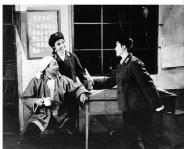
上世纪70年代,平顶山文工团演员在表演话剧《雷雨之前》。(资料图片)

脱颖而出。伴随着经济社会翻天覆地的变化,我市文化事业亮点频现,日日趋新。一甲子回望,我市一个个重大文化活动现场相继展开,一项项文化惠民措施温暖人心,一件件文艺精品时序更替,留下奋斗的足迹;新绿复萌,带来无限的希望。