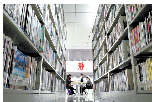
2013年2月28日,读者在市图书馆阅览室借阅图书。

文化产业是增强文化活力、促进文化自身繁荣的关键。改革开放以来,我市顺应时代潮流,积极实施“文化强市”发展战略,文化产业从无到有,稳步发展。截至“十二五”末,全市共有文化及相关产业法人单位1242个、企业法人960个。