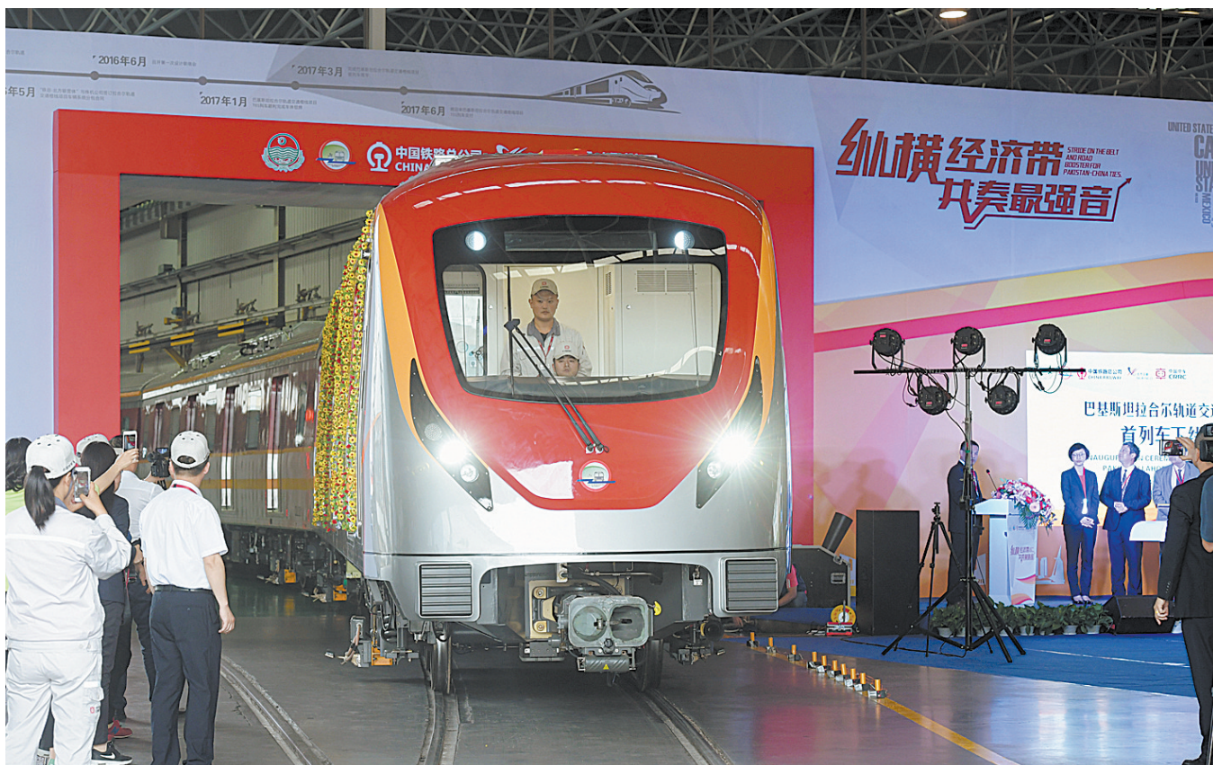
巴基斯坦拉合尔轨道交通橙线项目首列地铁列车在株洲下线 5月15日,巴基斯坦拉合尔轨道交通橙线项目首列地铁列车在中车株洲电力机车有限公司下线。巴基斯坦拉合尔轨道交通橙线项目首列地铁列车在株洲下线,当日,中巴经济走廊重点项目——

和理念,他们将在韩方与相关国家协商确定访问日程后尽快动身。李海瓚2004年至2006年在时任总统卢武铉政府内任国务总理,2003年2月曾作为候任总统卢武铉的特使访问中国。他多次当选国会议员,被认为是执政党共同民主党内资深人士。总统府一名不愿公开姓名的官员告诉新华社记者,李海瓚访华期间计划与中方人士就两国关系广泛交换意见,包括“萨德”问题和朝鲜半岛事务。据悉,李海瓚所率领的访华团还将包括国会议员、前驻华外交官以及智库研究员等多名成员。