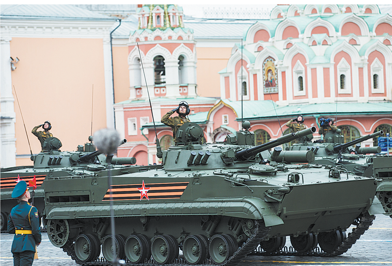
莫斯科举行阅兵式庆祝卫国战争胜利72周年

5月9日,在俄罗斯首都莫斯科,军车方队驶过红场。俄罗斯首都莫斯科红场9日举行阅兵式,庆祝卫国战争胜利72周年