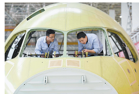
在四川成都,中航成飞民用飞机有限责任公司C919国产大飞机机头生产线工人在进行C919驾驶舱风挡装配操作(4月28日摄)

他表示,本周末,来自全球的有识之士们将齐聚北京,参加“一带一路”国际合作高峰论坛。举行这次论坛的目的就是总结经验,规划蓝图,分析问题,共迎挑战,形成合力