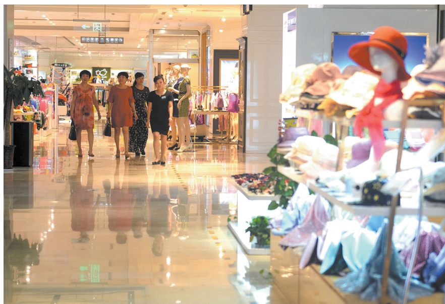
顾客在市区开源路中段一个商场内