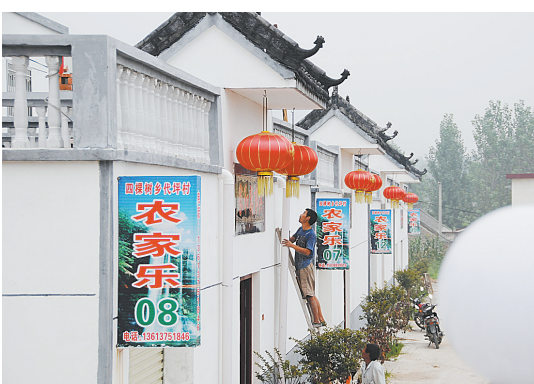
鲁山县四棵乡村代坪村引导村民利用自家新建楼房发展“农家乐”旅游

连胜安认为,这一时期我市的第三产业虽然得到了长足发展,但是站在更高的层次看,由于我市以国家投资为主体的国有企业比重过大,这些大型国有企业的服务产业内化倾向较为严重,对社会化的生产性服务业发展产生了一定的影响。