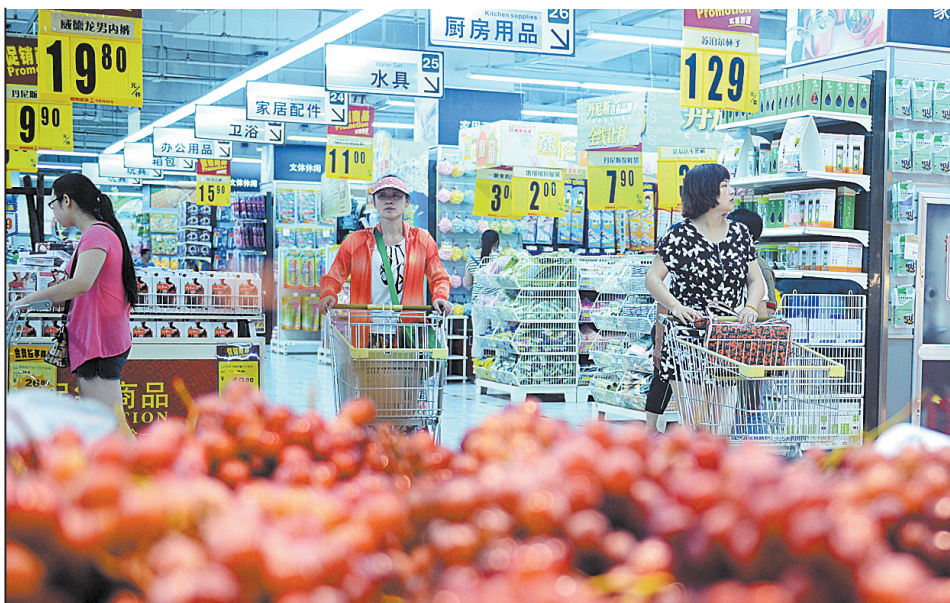
顾客在市区开源路中段一大型超市内

2016年,全市第三产业完成增加值743.1亿元,是1978年的471.8倍;第三产业占GDP的比重由1978年的16.3%上升到40.7%,较1978年提高了24.4个百分点;第三产业就业人数占城镇就业人数的比重超过40%。