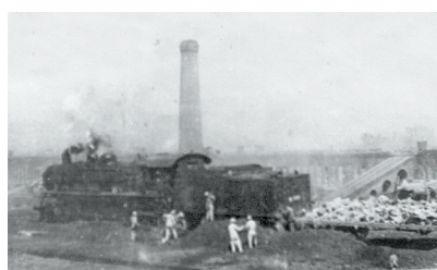
上世纪60年代焦化一厂焦炭外运

难能可贵的是，2016年，全市六大高耗能行业比重同比下降了0.4个百分点，非煤产业比重提高了0.6个百分点，高新技术产业比重提高了2.3个百分点，工业结构进一步优化。