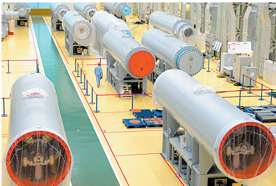
平高集团东厂区GIS车间加紧生产