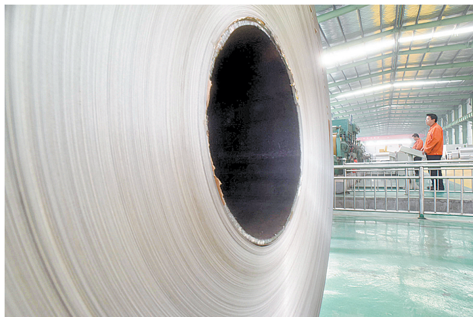
生产汽车用不锈钢板材