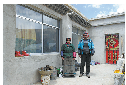
西藏聂拉木震后民房重建基本完成