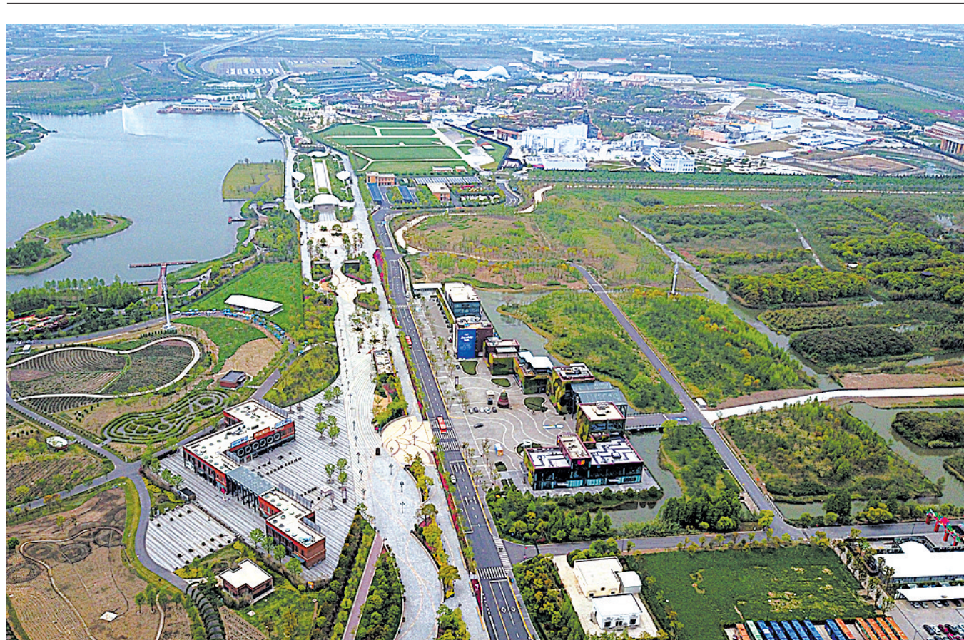
上海国际旅游度假区成“长三角”休闲经济新引擎

航拍上海国际旅游度假区(4月25日摄)。包含迪士尼、奕欧来等国际级旅游休闲项目的上海国际旅游度假区