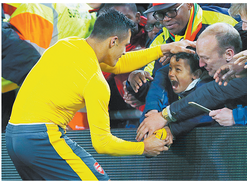
4月17日,阿森纳队球员桑切斯(左)在比赛后将球衣送给一名小男孩。