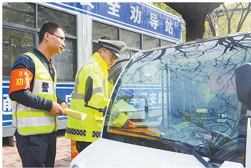
4月11日,志愿者配合执勤交警在新华区曙光街交通安全劝导站向一名驾驶四轮电动车进入禁行区域的驾驶员发放文明出行倡议书。

网友“Mike”:别一说电动车违章就赖汽车占道、违停,不否认个别非机动车道被违停汽车占据,但即便非机动车道没被占用,电动车上快车道情况也比比皆是。再说了,电动车逆行、闯红灯的情况也很多,而且人行道上就没有电动车违停吗?交通乱象不是一个群体造成的,都多从自身找原因。