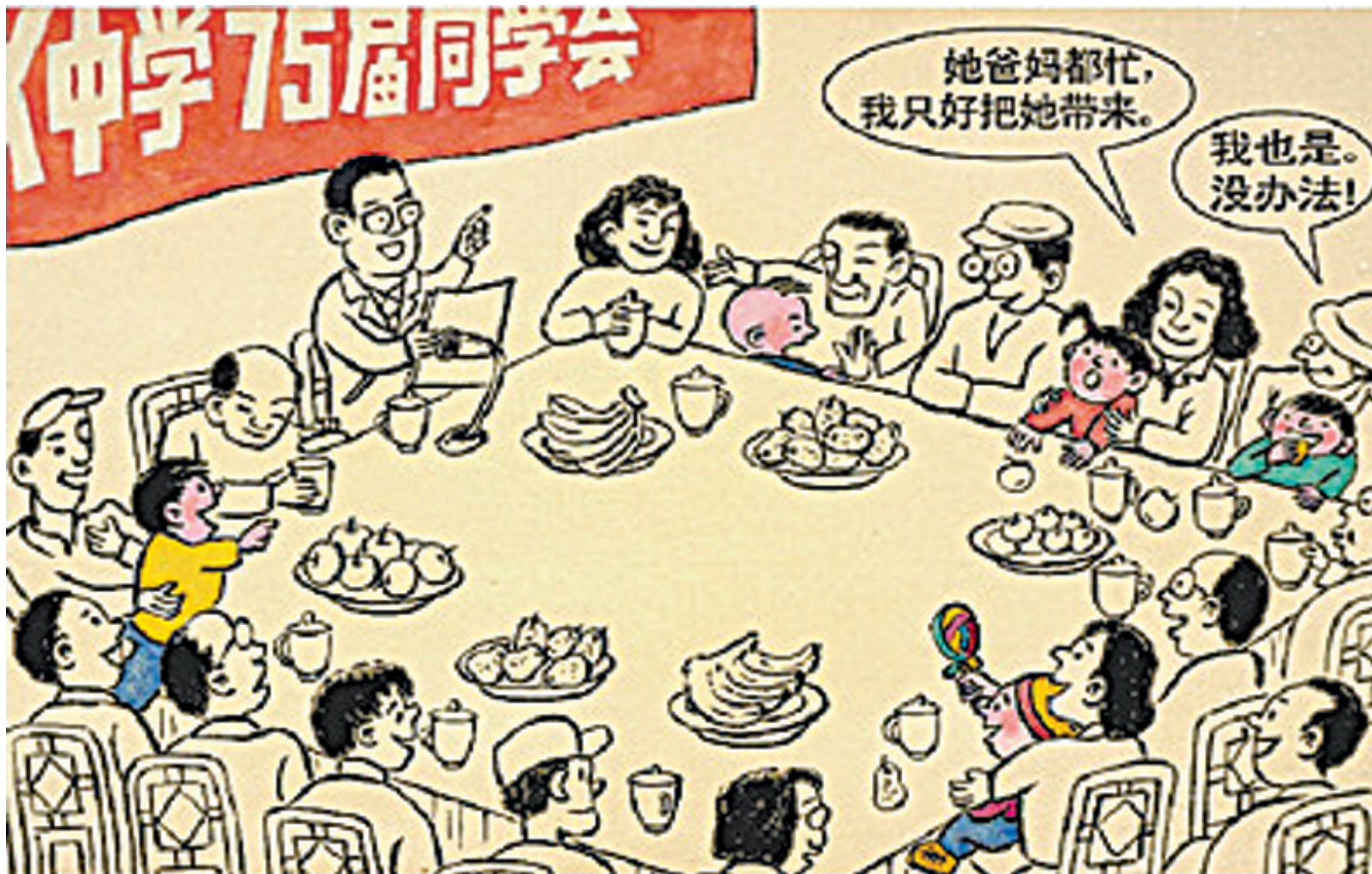
爷爷奶奶同学会 姚月法 作