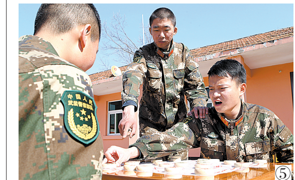
图①为巡山执勤 图②为坚持军体训练 图③为坚持学习 图④执勤之余忙生产 图⑤三个兵“一盘棋”

在鲁山县西部群山深处有一个执勤点,三名武警战士日夜守卫着一座国家重点仓库。多年来,他们与大山为伴,与林木为友,在平凡的哨位上用忠诚书写壮美的青春篇章。 3月14日,记者随武警平顶山市某队值班干部来到这个执勤点。这个执勤点地处偏远,交通不便,距最近的村庄约5公里。武警战士所需米、面、菜等基本生活用品由部队定期运送,一部内线电话和一个电台是执勤点与外界联系的工具,一台彩电和部分书报是战士们瞭望山外的窗口。