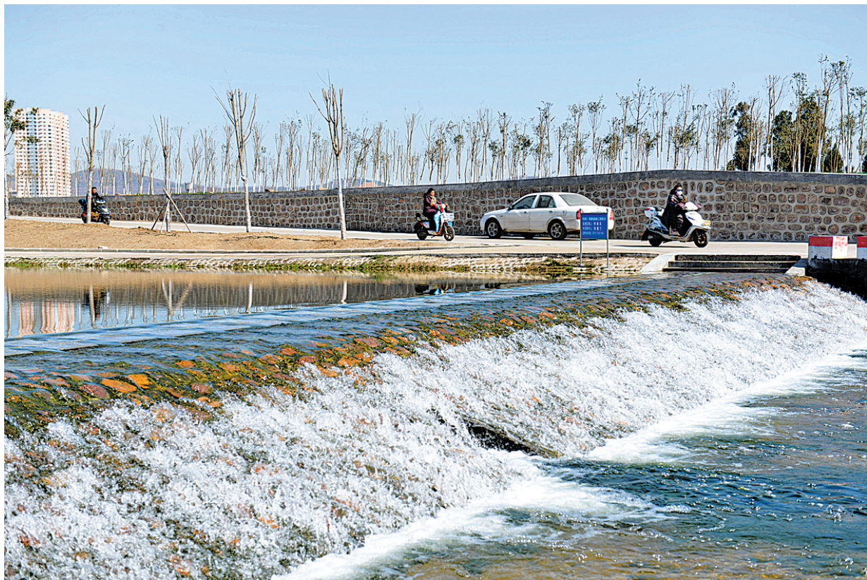
湛河治理成效初显

该县有关负责人表示,将积极适应经济发展新常态,开拓创新,狠抓落实,大力实施重点项目建设,持续增强经济增长动力。