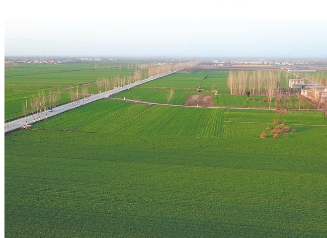
无人机拍摄的宝丰县闹店镇贾寨村麦田(摄于 1 月 8 日)。今冬我市多次降水,小麦长势良好。

去年,我市还进一步完善医疗救助制度,全面开展重特大疾病医疗救助工作,统筹城乡医疗救助制度。截至上月底,全市共资助 21.1 万人参保,3480 人享受住院救助,24600 人享受门诊救助,累计发放医疗救助金 4498 万元,最大限度地减轻了城乡贫困群众医疗费用负担。