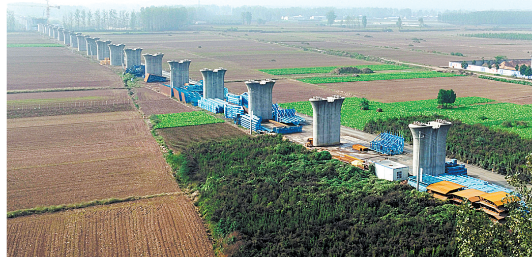
郑万铁路平顶山段建设扎实推进(10月17日摄于鲁山段)。

——计划新开工项目147个,总投资694.5亿元,前11个月完成222.8亿元,占全年计划投资的108.9%。平煤神马集团联合盐化100万吨/年真空制盐扩建项目、郑西高速公路鲁山段、沙河复航平顶山段等137个项目已经开工建设,为我市转型发展积蓄了强大能量。