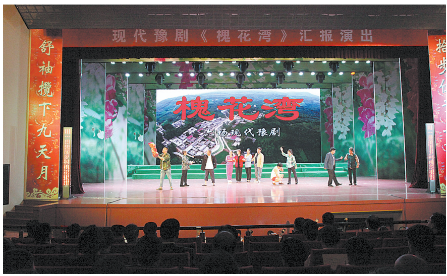
以叶县扶贫工作素材的大型现代戏《桃花湾》演出现场

力拔“穷根儿”奔小康,上述举措,仅仅是叶县强力实施脱贫攻坚系列举措的一个缩影。今年以来,叶县共有18500口人脱贫,40多个贫困村“摘帽”。