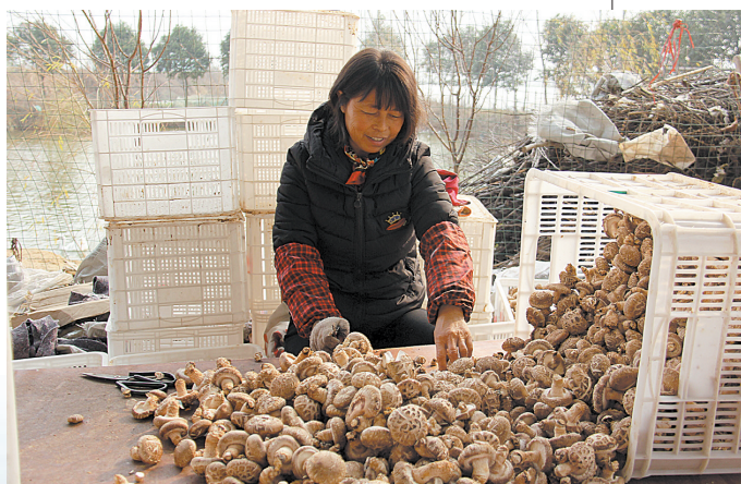
保安镇寨王村贫困户在该村的香菇产业园内分拣香菇