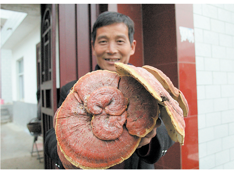
常村镇柴巴村脱贫农户展示自己种植的灵芝