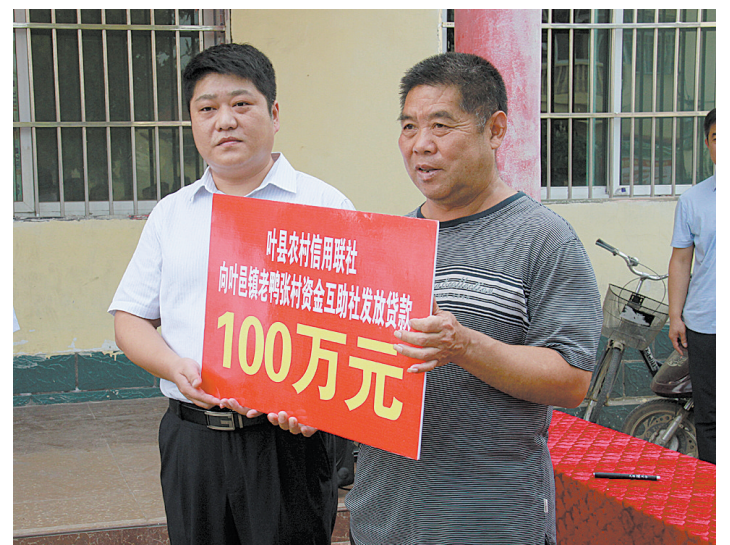
叶县农信联社为叶县镇老韩张村贫困户资金互助社发放贷款