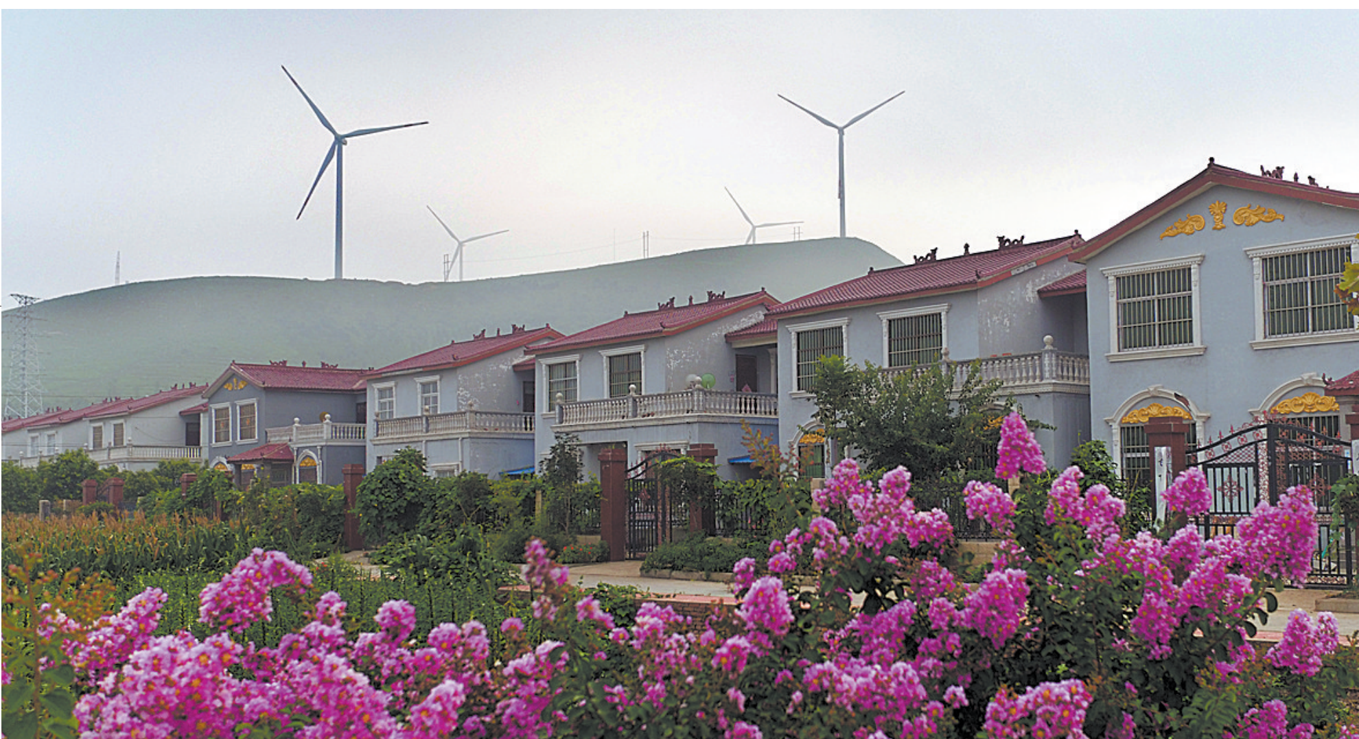
位于保安镇杨令庄村周围的风电项目,有力地推动了当地的扶贫工作