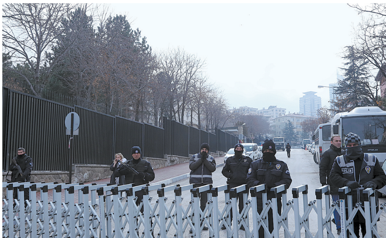
俄驻土使馆附近警卫森严

据克里姆林宫发布的消息,普京高度评价卡尔洛夫为外交事业作出的贡献,指出刺杀卡尔洛夫是恐怖分子的又一“卑鄙行径”,恐袭的目的是企图破坏俄土关系正常化和扰乱两国协调解决叙利亚问题,俄方对此只会作出一个回应——加强反恐,让恐怖分子自食其果。