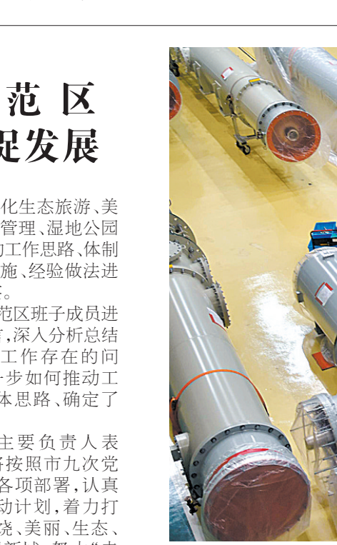
12月15日,职工在特高压装配厂房内组装组合电器。今年以来,平高集团在创新驱动战略带动下实现跨越式发展,前不久,“超特高压交流直流开关设备技术创新工程”项目荣获河南省科技进步一等奖。为提高产品质量,特高压装配厂房要求一尘不染,卫生标准达到医院手术室要求。

平煤神马集团有关负责人表示,上述项目已开工建设或处于论证阶段,待全部建成投产后可完全安置矿井地面人员。目前部分单位已经顺利对接,职工将进入新角色。