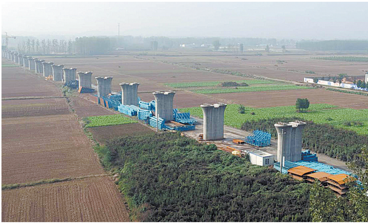
郑万铁路鲁山段一个个水泥承台已露出地面。郑万铁路在我市境内长约67.03公里,占河南段18.81%,其中鲁山段13.845公里为首批开工段。

消息一出,立即引发网友微博的关注和热议。截至14日,平顶山微报刊发的《平顶山市郑万高铁站周边规划定了!24所中小学、3所市市区级医院……》,阅读量已达4万+;平顶山传媒客户端刊发的《平顶山市郑万高铁站周边区域咋建设?详细规划都在这儿了》,阅读量超过8000人次。