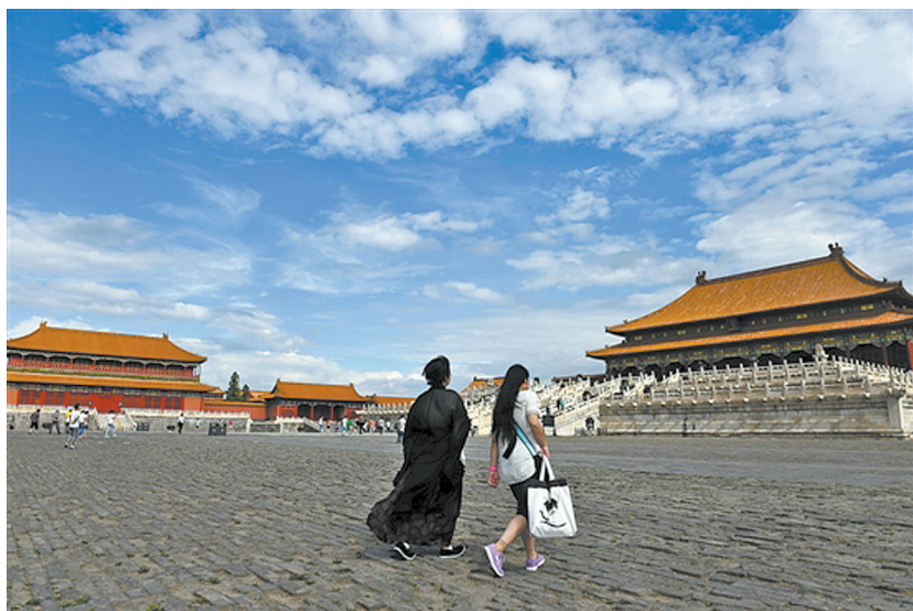
北京故宫