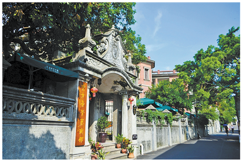
厦门鼓浪屿别墅