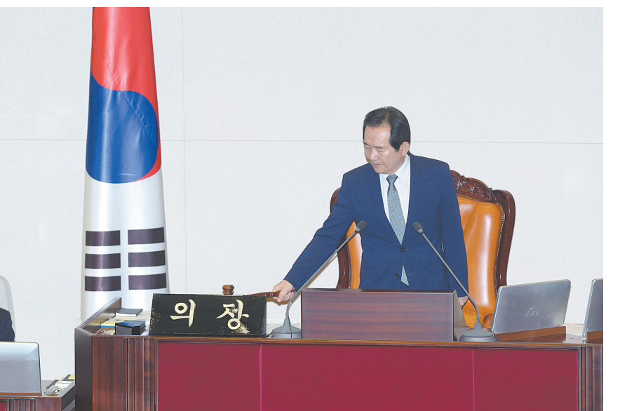
▲12月9日,在韩国首尔,国会议长丁世均宣布弹劾动议案通过。