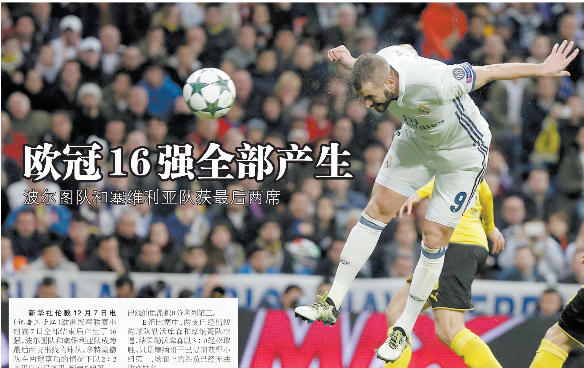
12月7日，皇马队球员本泽马在比赛中头球得分。