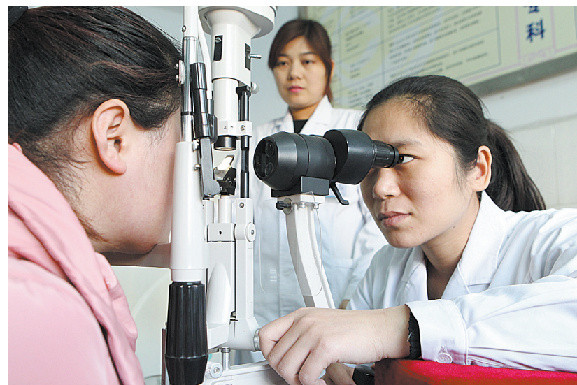
大风时节谨防“风流眼”

12月6日,一些眼疾患者在新华区医院眼科就诊。进入冬季,大风天气增多,每逢大风就会有不少迎风流泪的患者到医院眼科检查治疗。据悉,迎风流泪在冬季很常见,却很少有人知道这种“泪流不止”是一种眼科疾病,也就是“风流眼”。该科医生建议有以上症状的患者应早检查、早治疗,否则严重时会对视力造成不良影响。