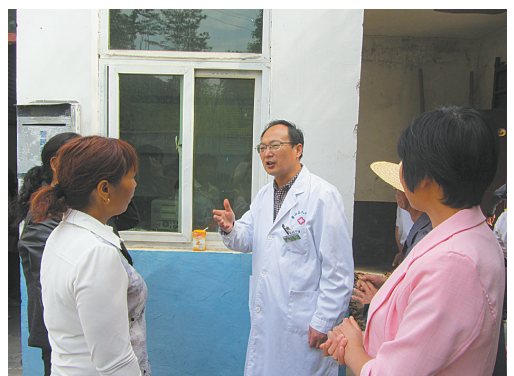
医院专家入村为村民普及健康知识