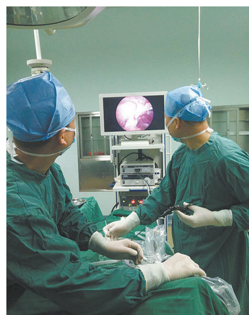
腹腔镜微创手术中