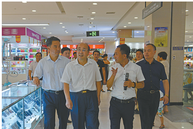
市委书记胡荃（前左二）在超市检查食品安全