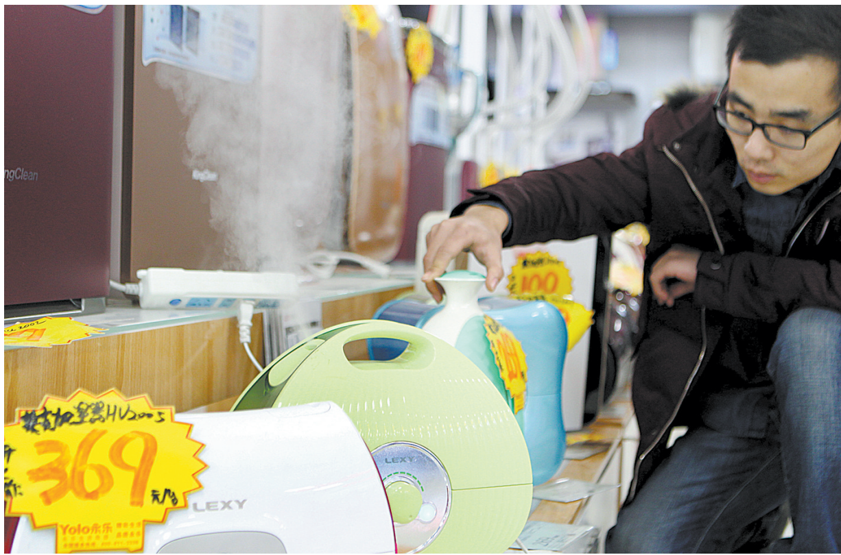
慎重选购，合理使用加湿器

七是报价显示不同。港股证券市场股票价格上涨时，股票报价屏幕显示的颜色为绿色，下跌时则为红色，与内地证券市场存在差异。但是，不同的行情软件商提供的行情走势颜色可以重新设定。