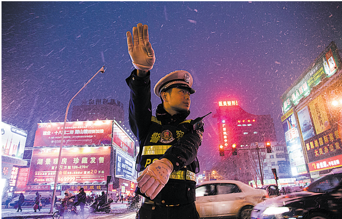
交警冒雪疏导交通以保安全