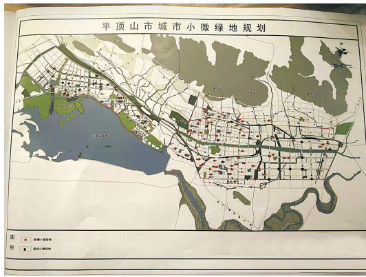
我市规划、新增101处小微绿地

近日,平顶山市城市小微绿地规划评审会召开。评审专家委员会经质询讨论,原则上通过了该规划。此规划的实施,可以完善我市中心城区绿地布局,解决公共绿地500米服务半径盲区问题。结合我市中心城区的实际绿地条件,平顶山市城市小微绿地按照“绿绕城、玉带贯城;山水棋盘、小微落子”的理念进行规划,规划新增101处小微绿地,呈星罗棋布在中心城区的街头,总面积132.18公顷。据介绍,小微绿地的规划与实践目前在全国尚为数不多,旨在解决大面积增绿不易难题,从小处着手增加生物多样性,进一步增加景观舒适度。