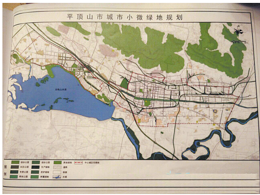
按照规划方案,我市城市小微绿地系统结构可概括为“一廊两环九放射,五带三区多节点”。