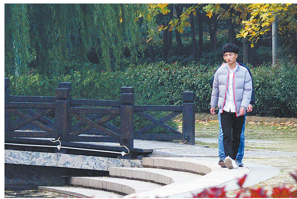
11月14日,两位游人在新城区长安大道西段一小游园内散步赏景。