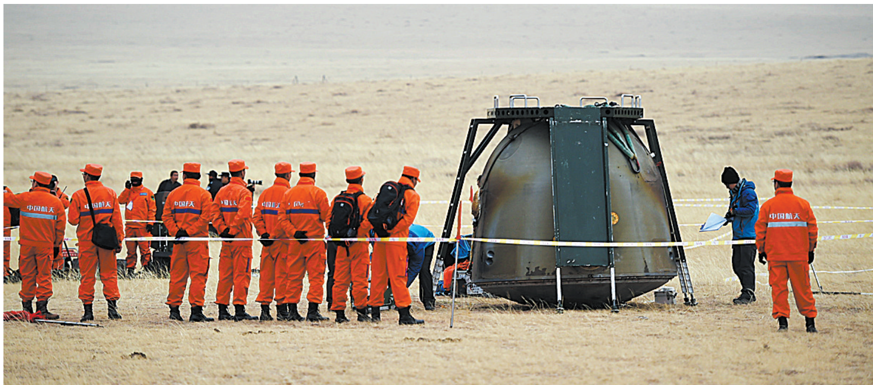
11月18日,工作人员在对返回舱进行处置。

据新华社内蒙古四子王旗11月18日电(记者曾涛)18日13时59分,搭载着航天员景海鹏、陈冬的神舟十一号返回舱在内蒙古四子王旗主着陆场安全着陆。飞行乘组两名航天员身体状况良好,安全出舱,并创下中国航天员太空飞行33天的最长纪录。