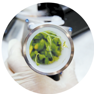
科研人员展示从太空返回并开花的拟南芥。

神舟十一号飞行乘组在太空驻留长达33天,其中在天宫二号空间实验室工作生活30天。 这次任务创造了中国航天员太空飞行时间最长的纪录,也为下一步中国航天员在空间实验室和未来空间站长期驻留收集了数据,积累了经验,打下了基础。 飞行乘组指令长景海鹏完成了他的第三次太空飞行,成为中国载人航天史上迄今飞行时间最长、次数最多、高度最高的航天员。航天员陈冬,六年磨一剑,终于圆了飞天梦想,也成为中国第二批航天员队伍中首次完成太空飞行任务的男航天员。 浩瀚宇宙,探索永无止境。作为人类开展太空实验,探索宇宙的平台,空间站是中国载人航天“三步走”战略的最高目标。中国载人航天工程办公室副主任杨利伟说:“神舟十一号飞行任务是承接第二步与第三步的关键之战,具有承前启后的重要意义。我们向着空间站的目标又迈进了重要一步。”