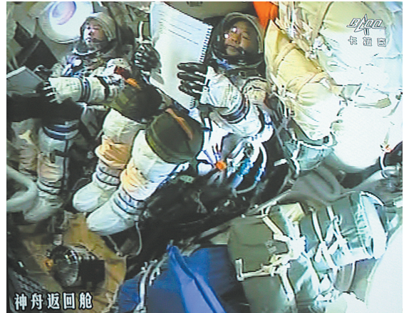
这是11月18日在北京航天飞行控制中心大屏幕拍摄的神舟十一号飞船返回舱内的画面。