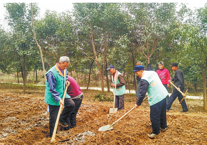
11月15日,舞钢市园林局组织10多名园林工人在该市建设路高速引线两侧开辟苗床,培育南天竹等苗木两万余株,为明年城区绿化作准备。