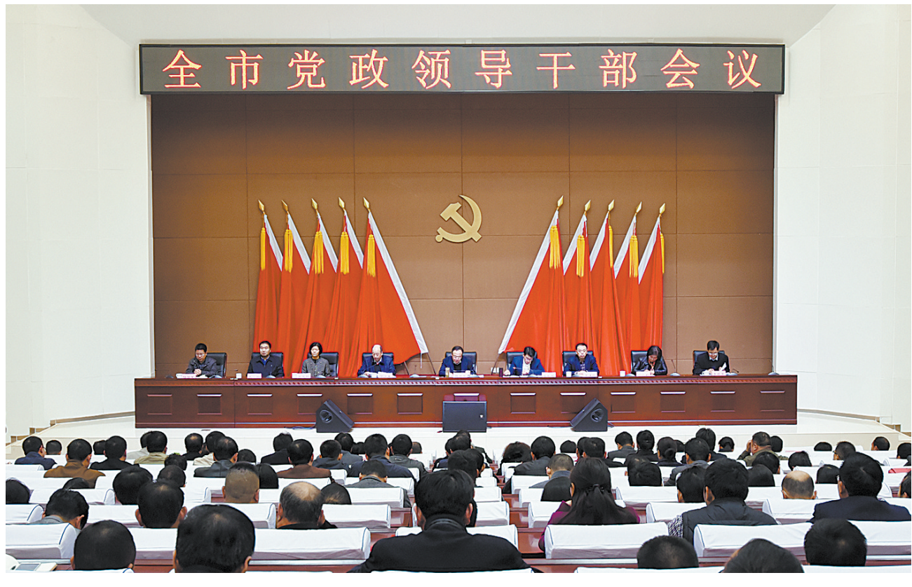
图为会议现场。

会议指出,党的十八届六中全会是在我国全面建成小康社会进入决胜阶段召开的一次十分重要的会议,具有里程碑意义。各级党组织和广大党员干部要把学习贯彻党的十八届六中全会精神作为当前和今后一段时期的一项重大政治任务切实抓紧抓好,迅速掀起学习热潮;要增强贯彻落实的自觉性和坚定性,真正把会议精神传达到每位党员干部群众,营造浓厚的学习氛围;要切实强化政治担当,坚定不移地推进全面从严治党,做到真管真严、敢管敢严、长管长严;要结合舞钢市实际,突出抓好经济运行调度,确保完成全年各项经济指标任务;要做好信访稳定、社会治安、安全生产工作,保证困难群众温暖过冬;要及早谋划明年的工作,特别是做好项目谋划,奋力夺取“十三五”开局之年新胜利,以优异成绩迎接党的十九大召开。