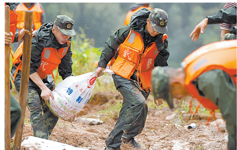
台风“鲇鱼”登陆福建 中央气象台发布双橙色预警

9月28日,福建省泉州市德化县水口镇一段乡村公路出现多处滑坡险情,武警泉州支队官兵在现场抢险施救。当日,今年第17号台风“鲇鱼”4时40分在福建省惠安沿海登陆。中央气象台6时发布台风橙色预警和暴雨橙色预警。