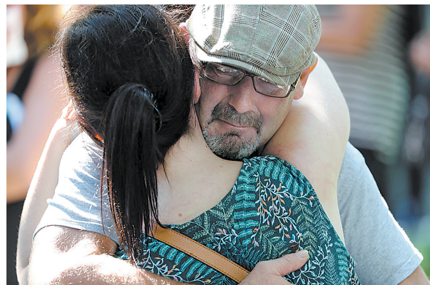
9月11日,受害者家属在“9·11”纪念活动现场拥抱。当天,“9·11”恐怖袭击事件15周年纪念活动在美国纽约“9·11”纪念广场举行。

开启战争易,收拾乱局难。假借反恐名义强推政权更迭,不仅使美国反恐失去道义制高点,更为中东动荡点燃导火索,为恐怖势力蔓延制造新温床。