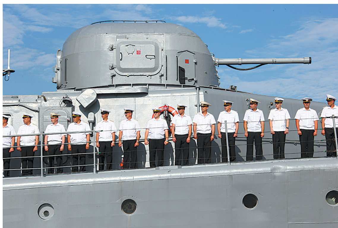
中俄军事演习俄方参演舰艇抵达湛江

组织模式、演练内容、导调指挥等方面进行了拓展和创新,首次按照红蓝方形式进行编组,红方兵力由中俄海军舰艇混编,蓝方兵力由中方舰艇担任。演习中,综合打击能力强、信息化水平高的郑和舰担任蓝方编队指挥官,指挥新型常规潜艇、新型战机从海底、水面及空中对红方舰艇编队实施多维度攻击。新型固定翼预警机将在演习空海域构筑复杂电磁环境,红蓝双方将以“背靠背”形式开展对抗训练。