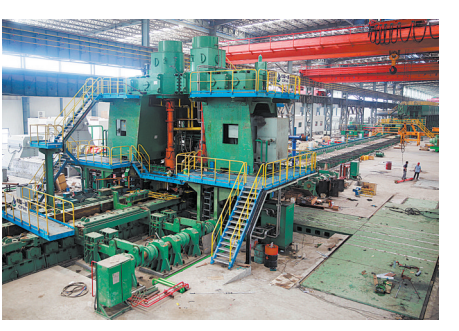
位于宝丰县商酒镇的正在建设的翔隆不锈钢

在金孟线平宝快速路口西南约300米处,来自平顶山中亚路桥建设工程有限公司的工作人员正在紧张地工作着。 金孟线平宝快速路至马街村路口段改建工程只是宝丰县和中亚路桥公司合作建设的项目之一。为破解交通设施落后、建设资金不足难题,近期宝丰县政府和平顶山中亚路桥建设工程有限公司正式签订战略合作协议,将精心筛选的13个关系到民生的交通基础设施建设项目,打包交给中亚路桥公司建设、运营和维护。 不仅如此,在国土资源合作开发、市政基础设施等方面,宝丰县政府近日先后与省国土资源开发投资管理中心、平煤神马建工集团签署合作框架协议,就郑万高铁平顶山西站周边商务区土地一级开发、宝丰县矿废弃地复垦利用、棚户区改造、标准化厂房建设、市政基础设施建设项目,全部采用新的合作建设模式,同时在煤化工和新能源等方面,宝丰县还积极推介本地的翔隆不锈钢、洁石煤化工等项目与平煤神马集团合作,从而实现“借梯上楼、借力发展、实现多赢”的目的。