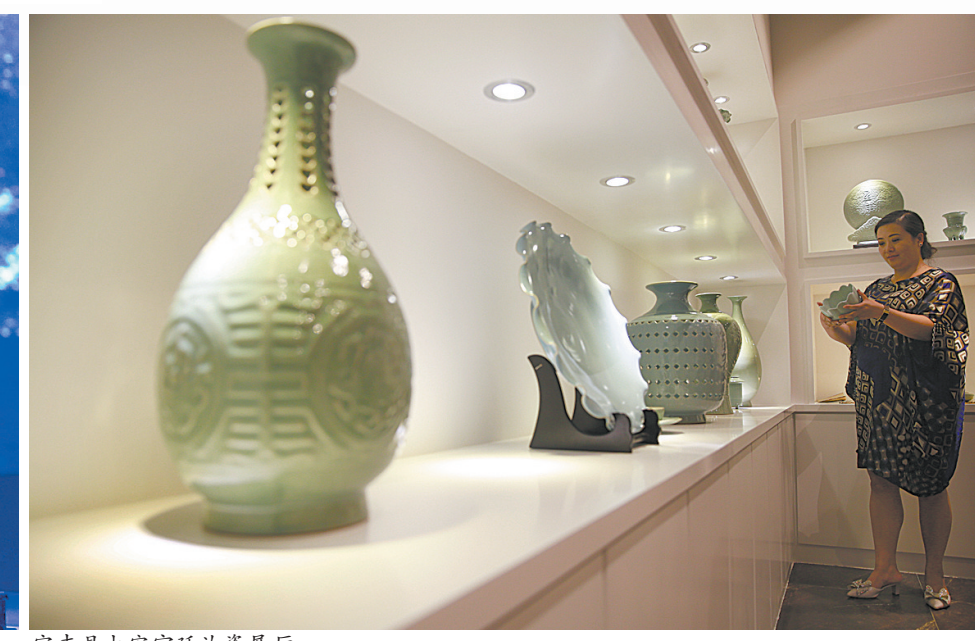
宝丰县大宋官窑汝瓷展厅