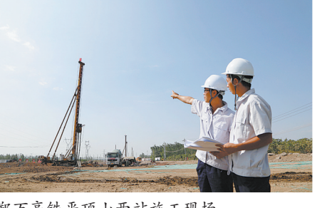
郑万高铁平顶山西站施工现场