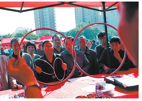
魔术道具展销商在展示魔术六连环

金秋时节,父城大地一派丰收景象。在宝丰县落地的河南中材环保、平顶山城孟电厂第二发电有限公司100MW光伏发电、产业集聚区2G太阳能光伏标准化厂房、鑫泰光伏100MW光伏发电站等18个在建项目正在如火如荼加紧建设。 宝丰县今年安排重点建设项目100个,总投资504.3亿元,年度预期投资目标131.2亿元,46个项目列入市重点项目,总投资242.6亿元,其中,6个项目列入省重点项目,总投资54.7亿元,省市重点项目数量和项目建设进度在平顶山(市、区)均排名前列,并在上半年重点项目考评中名列(市)第一名。 宝丰县坚持把重点项目建设作为拉动经济发展的有效抓手,每季度定期对重点项目建设进行观摩评比,坚持县领导分包包重点项目和定期召开重点项目建设联席会议制度,认真研究解决重点项目建设过程中的遇到的实际问题和困难,积极采取多种措施破解土地、融资等制约项目建设的瓶颈环节,为重点项目提供有力支持;坚持每个月举行一次重点项目集中开工仪式,为经济发展注入新的活力。同时,完善重大项目联审联批和模拟审批工作机制,提前介入,精准帮扶,限时办结;加强对项目的督导检查,建立定期通报制度,督