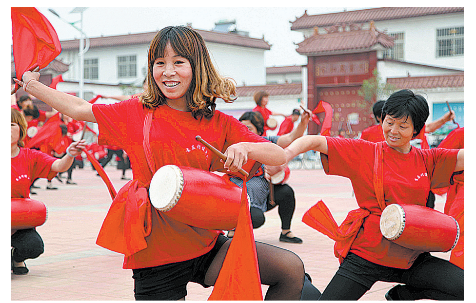
丰富多彩的村民文化生活