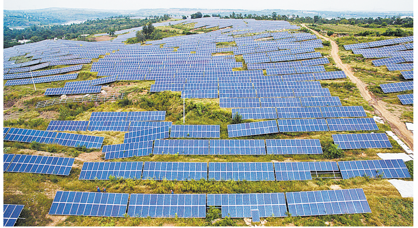
在宝丰县观音堂林店回龙庵村,郑州鑫泰工程建设的100MW光伏电站项目初具规模

位于宝丰县高新技术开发区内的翔隆不锈钢有限公司年产100万吨不锈钢板材项目如今进入了点火试车的倒计时阶段。这个总投资36亿元的项目建成后,将年产热轧不锈钢带钢100万吨,提供就业岗位1000多个,年增加税收2亿元。项目正式达产后,将为宝丰县不锈钢产业链增加关键的一环。 近年来,宝丰县委、县政府确立“依托大企业、做强大产业、延长产业链、建成大市场、形成新优势”的不锈钢产业发展思路,制定“打造千亿产业集群,建设长江以北最大的不锈钢深加工基地”的战略目标,主动加强与中国不锈钢协会、中国一重、中再集团等大企业、大企业的对接,通过承接产业转移,产业招商,促使一批不锈钢项目签约并落地建设。经过几年的发展,占地5000亩(北区2500亩,南区2500亩)的南北不锈钢产业园区已初具规模,基本形成了从研发到冷轧、平整、不锈钢板材及配套管材,到各种高中、低温不锈钢制品乃至废旧不锈钢回收利用,物流交易等为一体的产业链。 以大如拳、拳头强劲的“不锈钢产业”为代表,使宝丰这方创业热土激发出无限的发展潜力。以装备制造为主导的新能源产业亮点纷呈,新兴的现代制造业方兴未艾,通过华丽转型的煤化工等传统工业生机盎然,小微企业异军突起,在如今的父城大地,一派勃勃生机的景象。 平宝一体化的实施,城乡一体化示范区的建设,郑万高铁宝丰段及平顶山站的开工,平顶山轻轨、漯平洛城际铁路的规划,必将拉动宝丰县经济实现跨越发展;一大批重点项目建成投产,30亿元以上项目有序推进,宝丰经济发展的基础更加坚实;沿海地区产业的持续转移,为宝丰承接产业转移、完善产业链条提供了发展机遇,淳朴、勤劳的群众、敬业、包容的干部,各级党组织始终保持着凝聚力、向心力,为加快发展注入了新的活力和持续动力,这些都为宝丰今后的发展积蓄了巨大潜能,也将使这座古老而现代的城市以更加昂扬的姿态,在转型发展的道路上阔步前行。