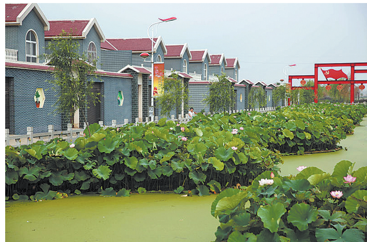
宝丰县赵庄镇袁庄村,村民新居旁荷花次第盛开

灿烂的文化遗产,滋润着一代代又一代宝丰人的心田。马街书会历经700年而长盛不衰,宝丰魔术绵延数百年而昌盛不衰;这里有五大名瓷之首的清凉寺官窑遗址,有穿越4000年的中国名酒宝丰酒,均被列入国家级非物质文化遗产名录;这里是汉文化景观出生得道证果之地;这里有刘邓大军驻地中原局、中原军区、中原野战军旧址,是解放战争时期逐鹿中原的红色首府,也是第六位华裔诺贝尔奖获得者崔琦的故乡。丰富的文化资源,是宝丰叫响全国的宝贵财富,成为宝丰叫响全国、走向世界的靓丽名片。 自古属中州灵秀之地的宝丰,有着丰厚的文化底蕴,是“中国曲艺之乡”“中国魔术之乡”“观音文化之乡”“中国民间文化艺术之乡”和“中国汝窑文化之乡”,同时也是全国文化先进县。 重视文化自繁荣。宝丰县高度重视文化产业发展,以“文化惠民、文化利民、文化为民”为宗旨,不断繁荣文化事业,大力发展文化产业。宝丰县设立了魔术演艺发展基金,成立文化投融资有限公司,连续举办了五届中国·宝丰魔术文化节,成功推出了丁德龙等一批民间艺人走向全国,规划和建设了文化创意产业园区、汝官窑古遗址公园、宝丰魔术梦幻园、马街书会民俗园、观音文化旅游园、红色历史博物馆和宝酒文化产业园等七个文化产业园,一场轰轰烈烈的文化建设热潮正在宝丰大地蓬勃兴起。 宝丰文化底蕴深厚,文化资源丰富。近年来,宝丰县明确了“由文化资源大县向文化产业强县跨越”发展思路,加大投入,统筹规划,全面推动全县文化产业