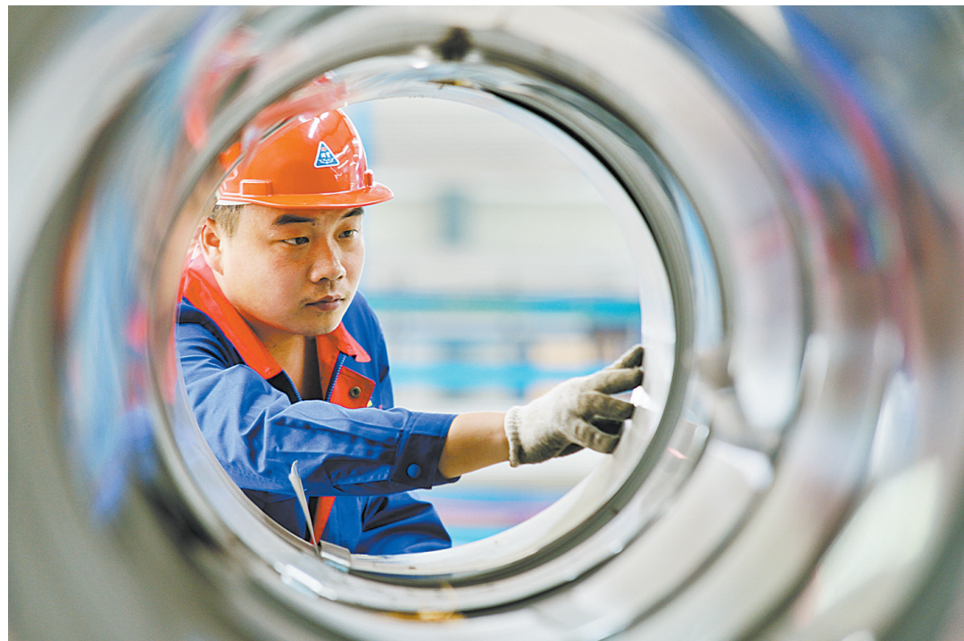
卫东区泽楷金属制品有限公司工人在检查钢板基材质量

针对年初重点项目建设任务完成情况，加大对重点项目的督办力度，分包项目的四大班子领导和有关部门经常深入项目建设单位摸实情、掌实据、解难题。一