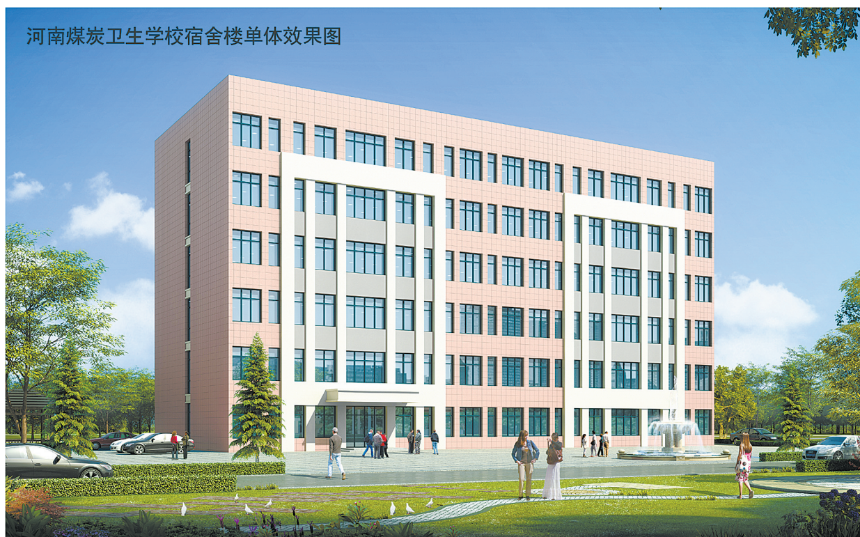
河南煤炭卫生学校宿舍楼单体效果图