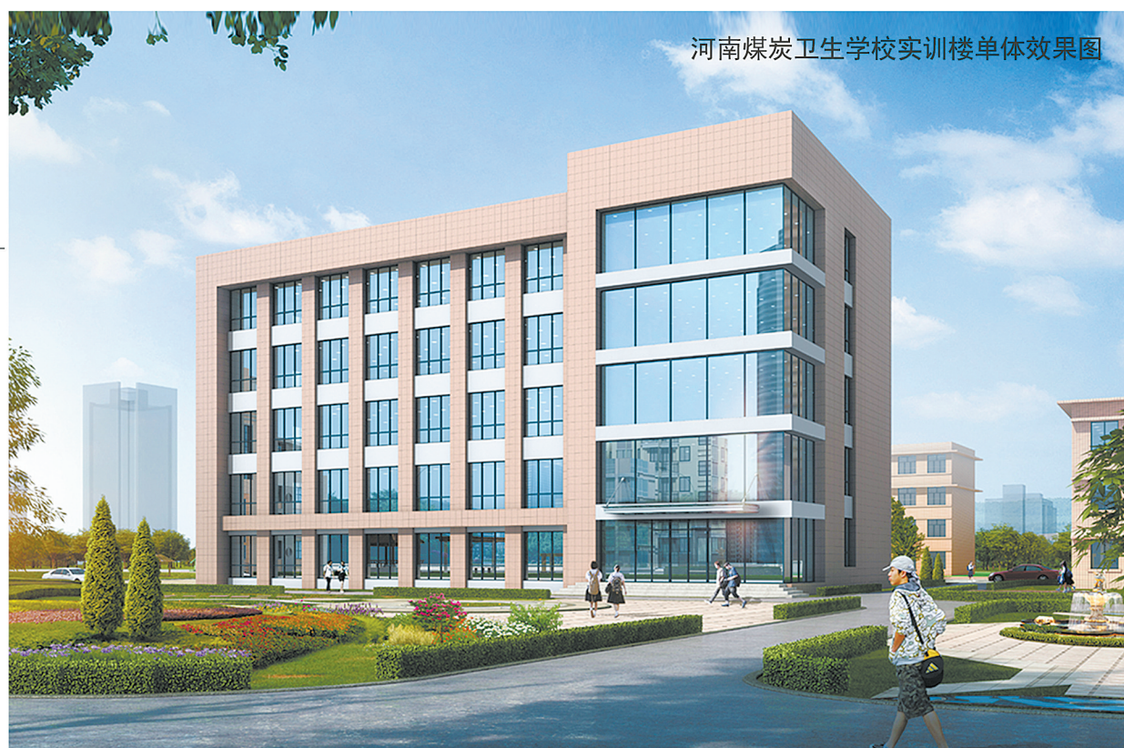
河南煤炭卫生学校实训楼单体效果图