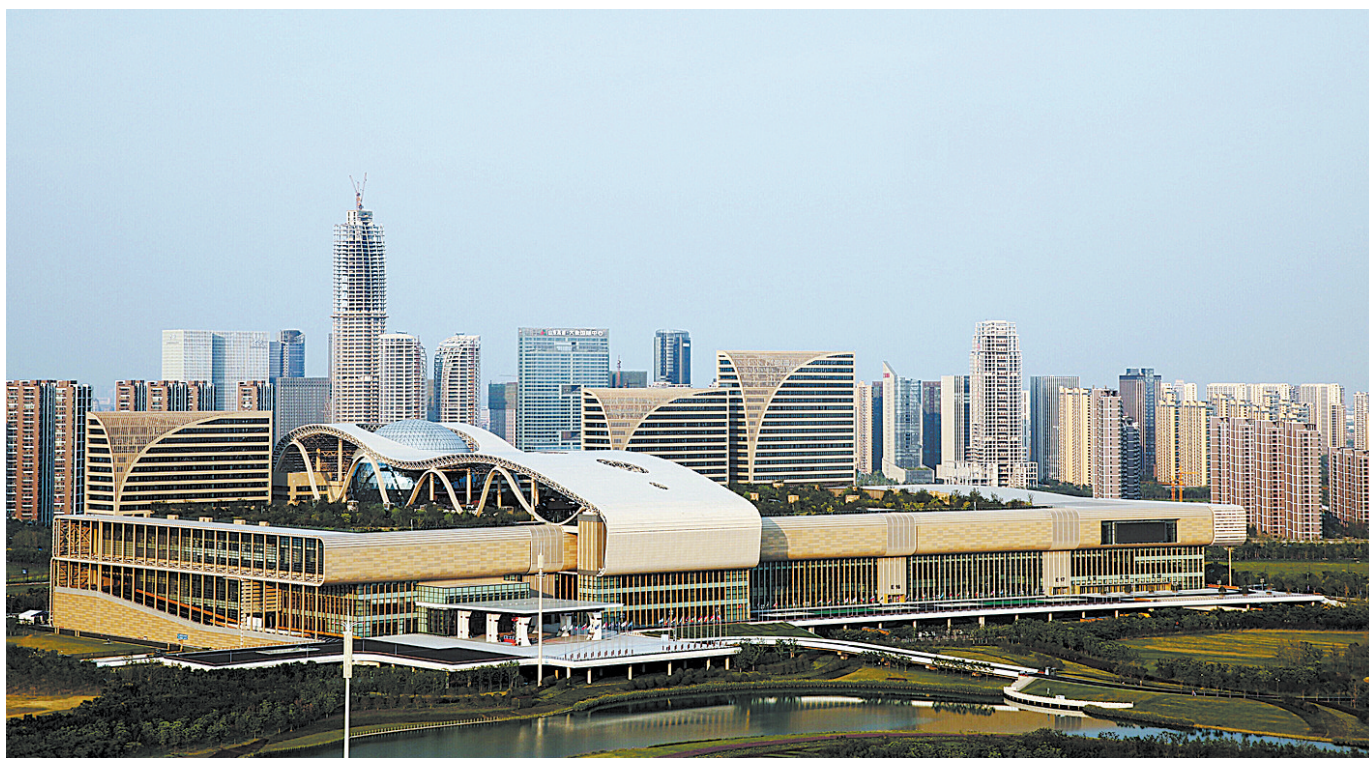
9月2日拍摄的杭州国际博览中心。二十国集团(G20)领导人杭州峰会将于9月4日至5日在杭州举行。峰会主场馆杭州国际博览中心和各种配套设施准备就绪,静待八方来客。

接棒二十国集团(G20)主席国270多天的中国已搭好舞台,迎接G20杭州峰会登场。