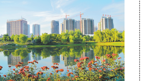
建设中的市城乡一体化示范区

2011年，省委、省政府批准我市新区建设总体规划，2013年更为平顶山市城乡一体化示范区，规划面积295平方公里（含白龟湖水面和生态保护用地99平方公里），功能定位为“三区一中心”，即城乡一体化先行区、豫中南综合交通枢纽和物流中心、行政区划涉及新城区4个镇（街道）、新城区3个镇（街道）、湛河区4个镇（街道）、宝丰县及其4个乡镇（街道）、鱼山镇4个乡镇。 市委书记胡荃在示范区调研时指出，“要进一步完善发展规划，明确功能定位，推动各项事业走在全市前列，努力进入全省城乡一体化示范区建设第一方阵，着力打造生态、宜居、美丽的山水园林新城。”为示范区的未来发展指明方向。 市长张国伟也非常关注示范区的区的发展，多次在新城区现场办公，并强调，要坚