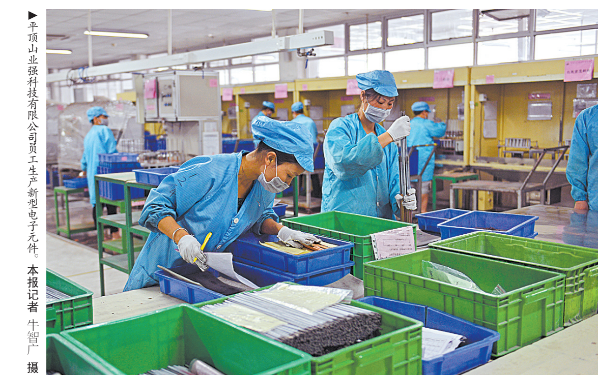
▲平顶山业强科技有限公司员工生产新型电子元件。