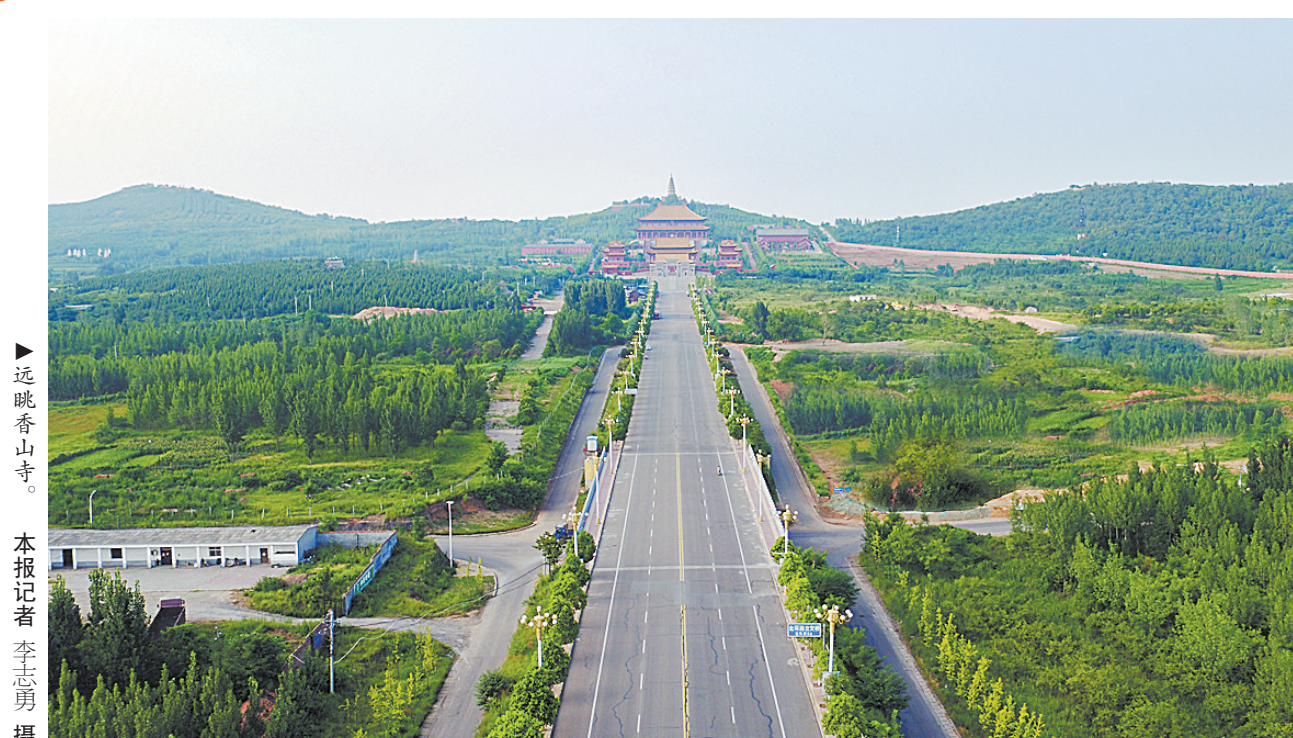
▲平顶山白龟湖国家城市湿地公园。