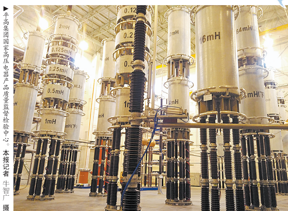
▲平高集团国家高压电设备品质监督检验中心。