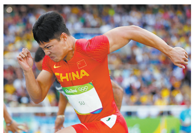
8月13日，中国选手苏炳添在里约奥运会男子100米预赛中比赛中。当日，在2016年里约奥运会男子100米预赛中，中国选手苏炳添以10秒17的成绩晋级半决赛。

苏炳添和男子4×100米接力的其他三名队友在里约以第四名创造了中国在奥运会这个项目上的最佳成绩，他表示，队友们的互相帮助和支持让他感觉这个团队很亲切。