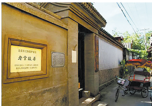
▲北京故居 ▼青岛寓中摆放的兵器

老舍（1899年2月3日—1966年8月24日），原名舒庆春，字舍予，现代著名作家、杰出的语言大师，被誉为“人民艺术家”。老舍是满族正红旗人，父亲是一名满族的护军，阵亡在八国联军攻打北京城的时候。老舍一生勤奋笔耕，创作甚丰，代表作有《四世同堂》《茶馆》《骆驼祥子》等。老舍的文学语言通俗简易，朴实无华，幽默诙谐，具有很强的“京味儿”。1966年8月24日，老舍逝世。