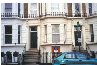
▲伦敦故居 ▶老舍、胡絮青《书画合璧》