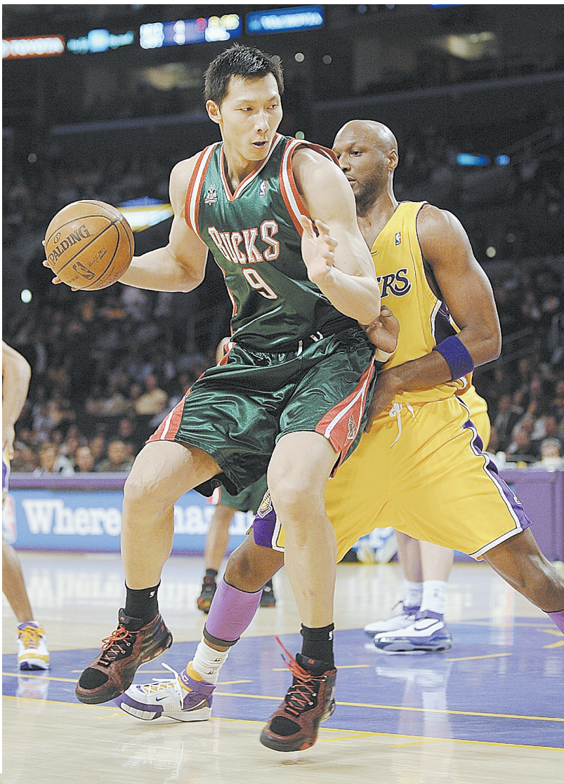
►图为2008年1月11日，在NBA常规赛中，密尔沃基雄鹿队球员易建联(左)突破洛杉矶湖人队球员的防守。

他于2012年回CBA广东队，帮助球队夺得2013年总冠军，他本人也第二次当选总决赛MVP。