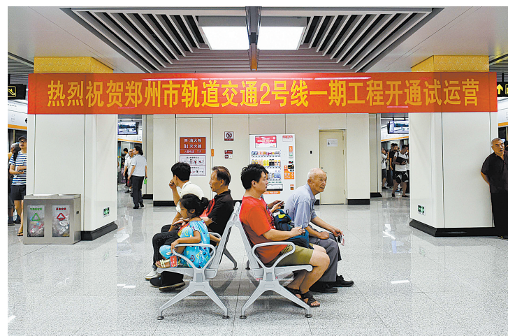
郑州地铁2号线一期工程开通试运营

住房和城乡建设部、发展改革委、人民银行、银监会等七部门《关于加强房地产中介管理促进行业健康发展的意见》近日出台。落实新规,以诚信典型“红名单”和严重失信主体“黑名单”制度,清除害群之马,才能使房地产中介更好地服务于房地产市场建设。 不良中介机构通过隐瞒成交价格、隐瞒房屋状况、拖欠租金、违规打隔断出租、强行进行资金监管、租期届满不退押金、违规收费、提前终止租赁合同、违规从事金融业务等各种方式谋取不正当利益。 值得关注的是,随着房地产市场不动产属性不断深化,房地产中介围绕房屋买卖、租赁业