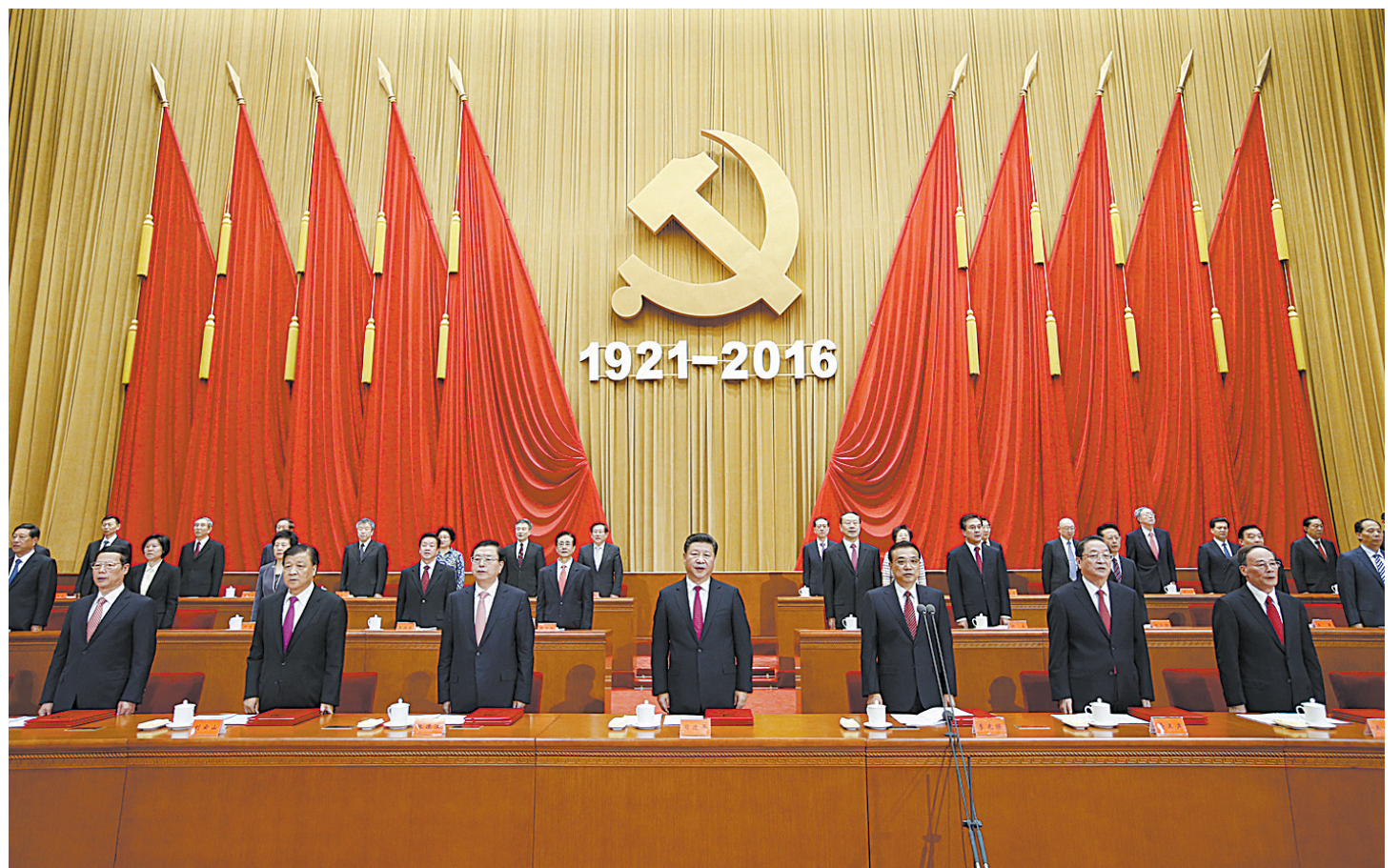
7月1日,庆祝中国共产党成立95周年大会在北京人民大会堂隆重举行。习近平、李克强、张德江、俞正声、刘云山、王岐山、张高丽等出席大会。

新华社北京7月1日电(记者霍小光 张晓松)庆祝中国共产党成立95周年大会7月1日上午在北京人民大会堂隆重举行。中共中央总书记、国家主席、中央军委主席习近平在会上发表重要讲话强调,我们党已经走过了95年的历程,但我们要永远保持建党时中国共产党人的奋斗精神,永远保持对人民的赤子之心。一切向前走,都不能忘记走过的路;走得再远、走到再光辉的未来,也不能忘记走过的过去,不能忘记为什么出发。面向未来,面对挑战,全党同志一定要不忘初心、继续前进。