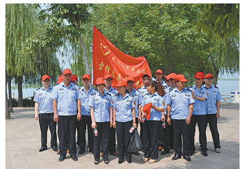
学雷锋志愿者服务队