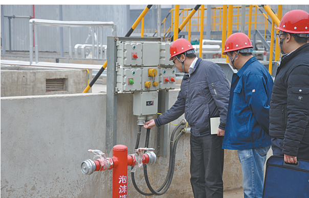
督导企业排查治理隐患