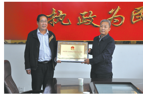
省人民满意公务员示范岗授牌