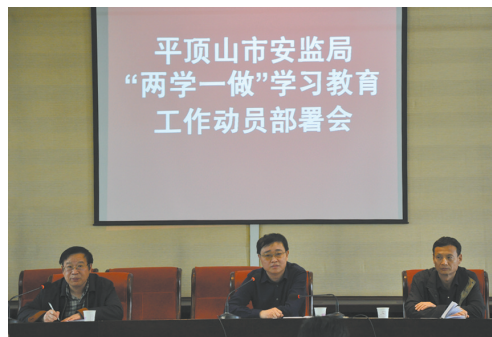
部署“两学一做”学习教育